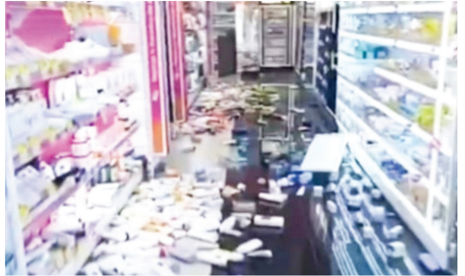
Captura de video tomada a través de rastreo de redes tras un sismo de magnitud 6,1 que se sintió este martes, en la región de Ica, en el sur de Perú.

Según el Canal N de televisión, el sismo causó serios daños en el cementerio antiguo de Ica, donde colapsaron pabellones con nichos y quedaron