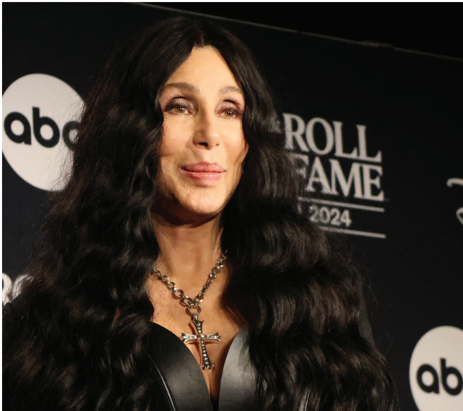
La cantante Cher en 2024.

Pero reducir a Cher a la música sería olvidar