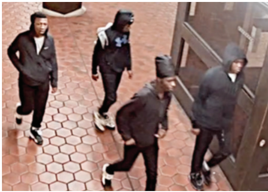
Los 4 sospechosos