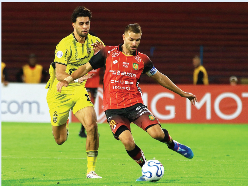
El futbolista brasileño Neymar de Santos, durante un partido disputado el pasado 5 de mayo.