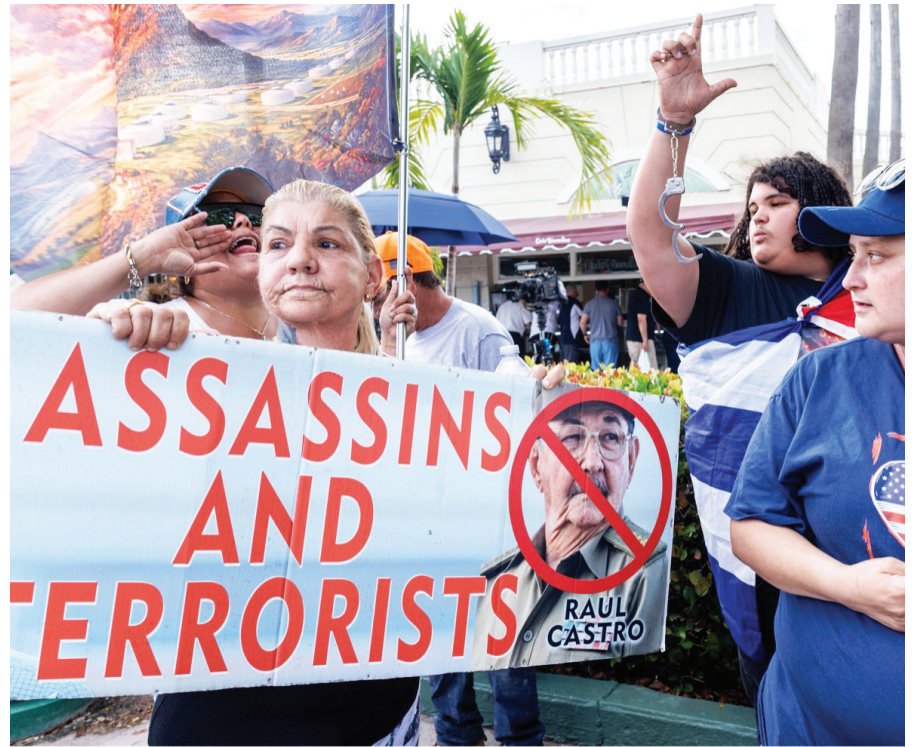
Cubanos en el exilio sostienen un cartel que dice “Asesinos y terroristas” mientras celebran el Día de la República de Cuba en Miami, Florida, EE. UU., el 20 de mayo de 2026.