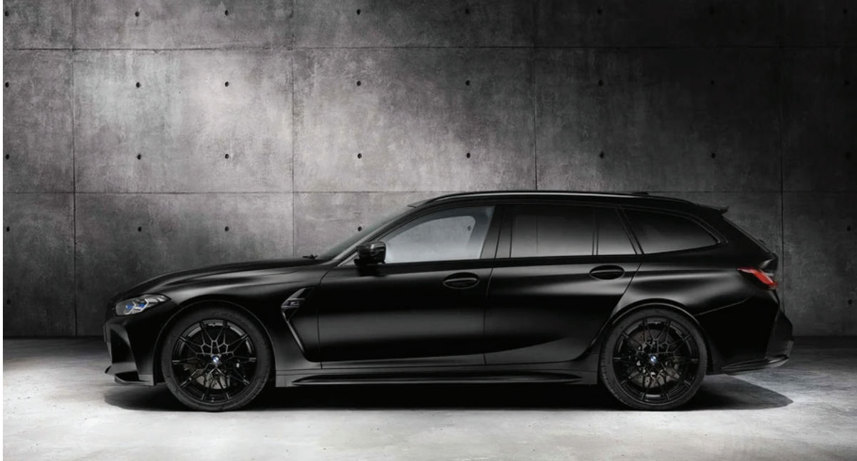
El M3 Touring conserva el diseño agresivo que caracteriza a la generación actual del M3.

Además, representa una rareza dentro de la industria. En tiempos donde los SUV dominan el mercado global, BMW apostó por una carrocería familiar