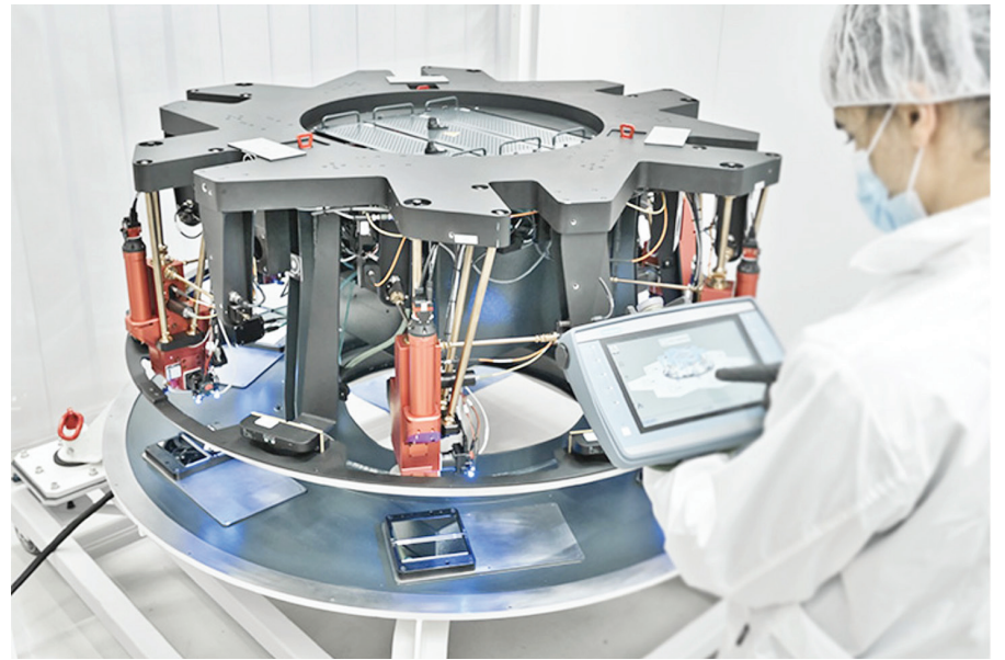
Pruebas con el Local Coherence en las instalaciones de la empresa IDOM.