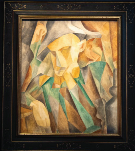
La obra ‘Arlequin (Busto)’, del artista español Pablo Picasso, durante la exhibición a la prensa de las piezas que subastará este mes la casa Sotheby’s en Nueva York (NY, EE.UU.).