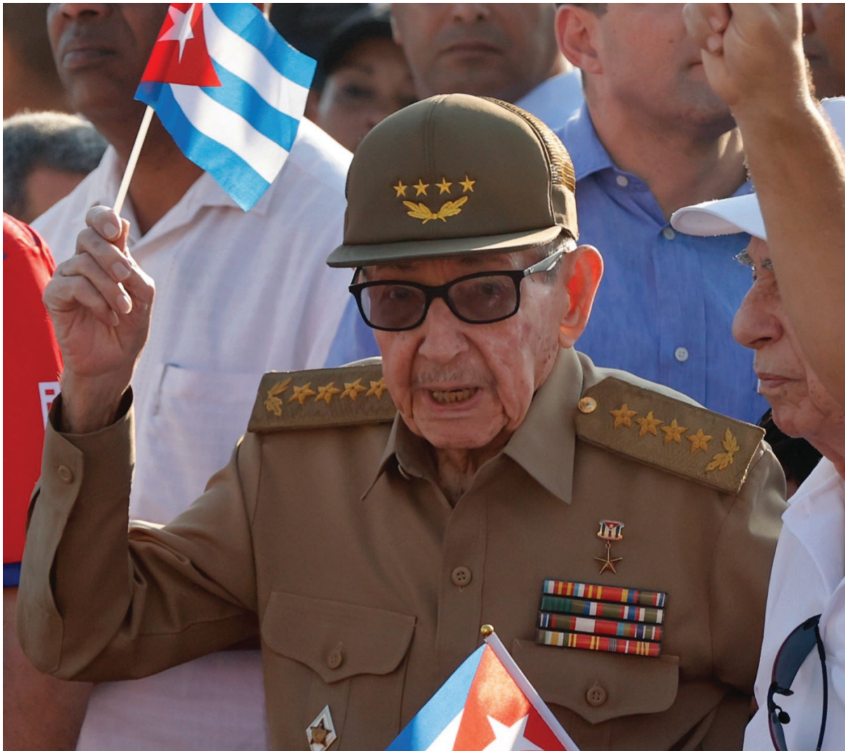
Expresidente de Cuba Raúl Castro.