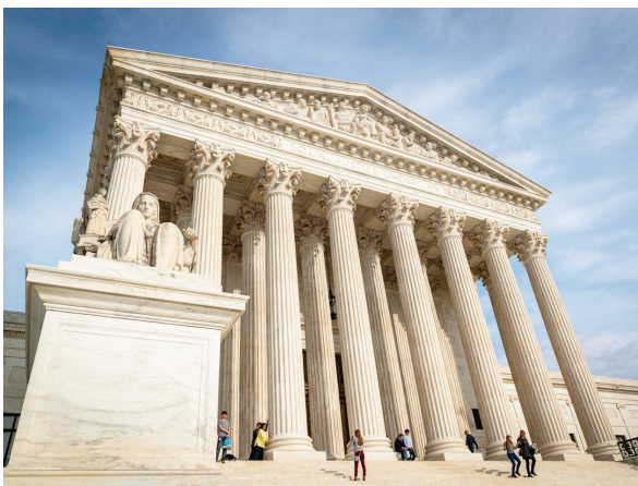
Corte Suprema de Estados Unidos rechazó una apelación de emergencia presentada por líderes demócratas de Virginia.

Según el escrito judicial, obligar a Virginia a celebrar elecciones congresionales utilizando distritos distintos a los establecidos mediante una enmienda constitucional aprobada por los votantes socava el derecho de residentes, candidatos y autoridades estatales a re-