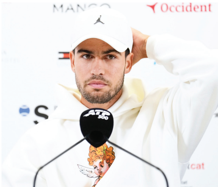
El español Carlos Alcaraz, durante una rueda de prensa en el Barcelona Open Banc Sabadell-Trofeo Conde de Godó.

"Mi recuperación va por buen camino y me siento mucho mejor, pero desgraciadamente aún no estoy listo para poder ju-