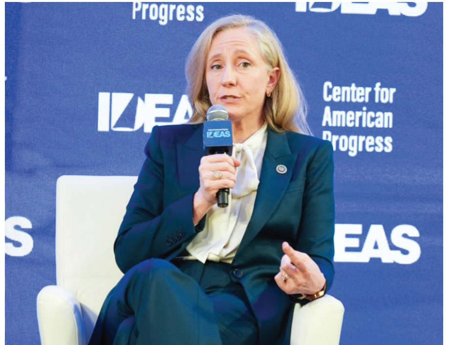
La gobernadora de Virginia Abigail Spanberger, habla durante un evento este martes, en Washington (Estados Unidos).

En un año clave para Estados Unidos, a pocos meses de que se celebren las elecciones de medio mandato, los demócratas ponen a punto sus discursos.