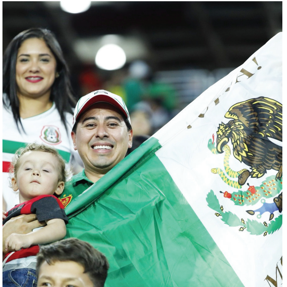
Fanáticos que apoyan a México previo al partido de la selección mexicana.

En formatos, predominarán los resúmenes de partidos, con 55 %, mientras que 45 % dijo preferir resúmenes antes que partidos completos.