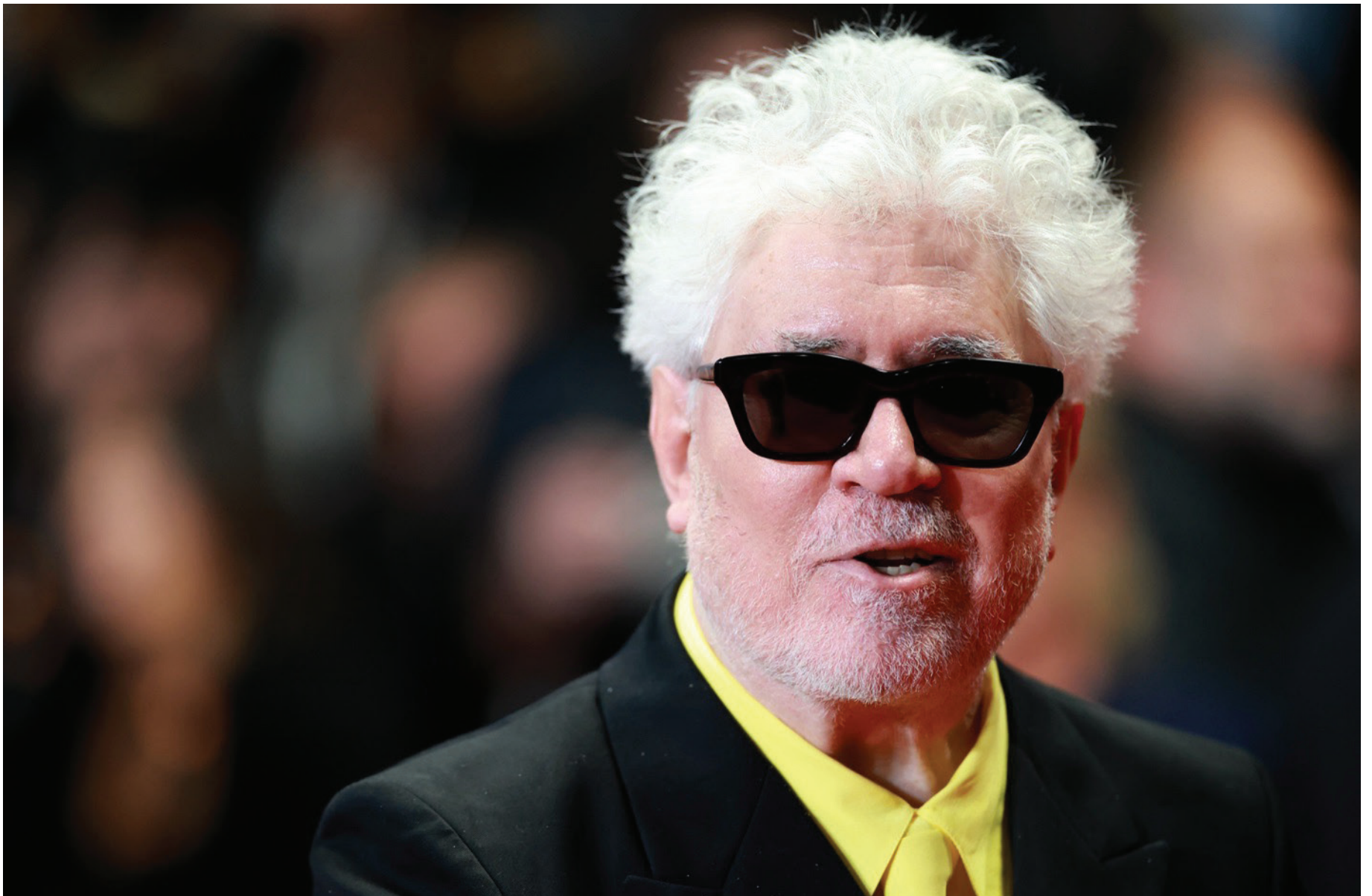
El director Pedro Almodóvar sale de la premiere de “Amarga Navidad” durante el 79º Festival de Cine de Cannes, en Cannes, Francia. (Cine, Francia.