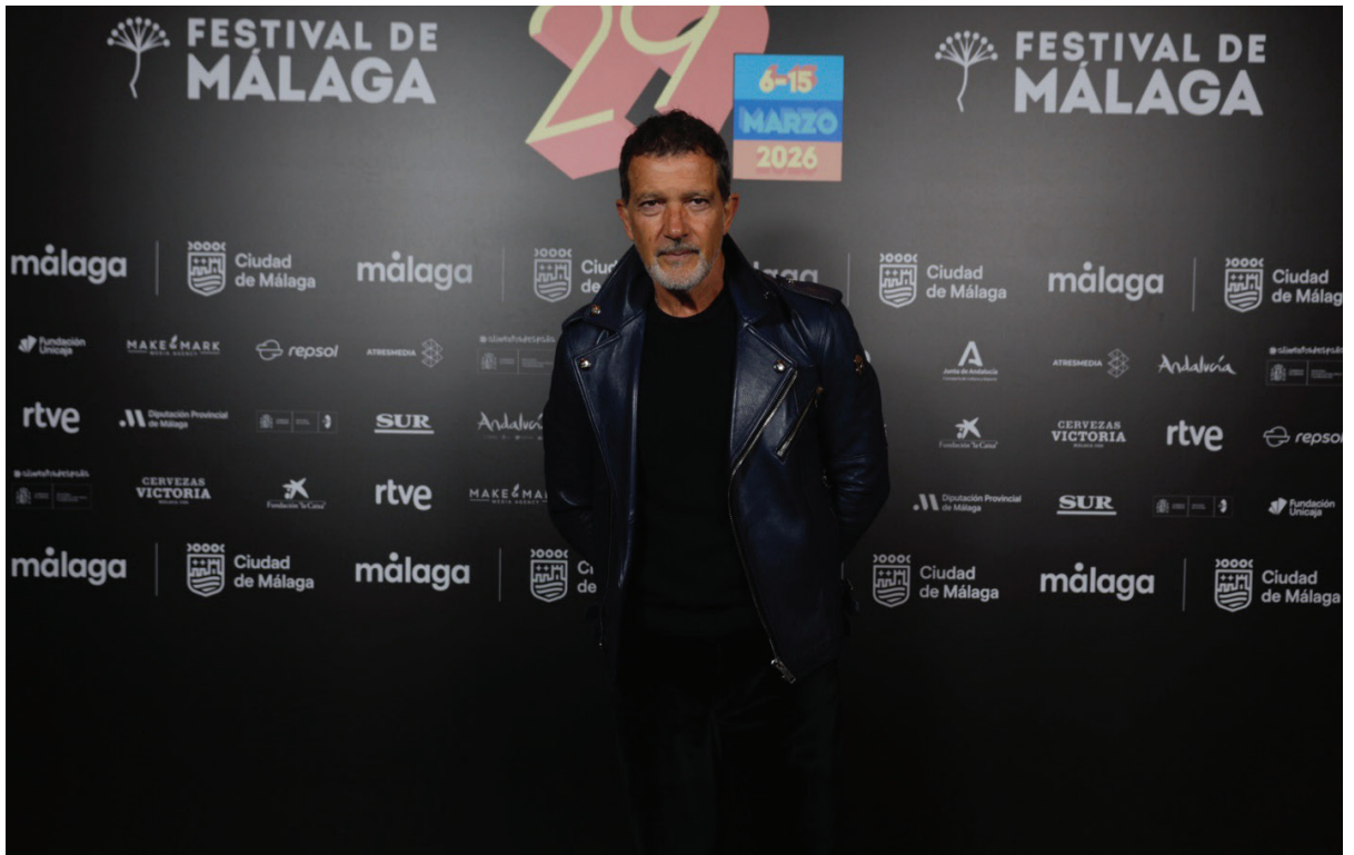
El actor Antonio Banderas.

Ha aclarado que el Teatro del Soho CaixaBank es “una empresa privada sin ánimo de lucro que más bien opera como un teatro público”. Esto implica que “el proyecto no recibe subvenciones de dinero público y no lo hará mientras yo esté vivo”, ha