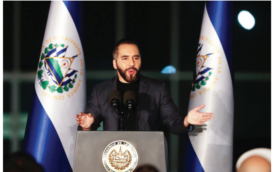
El presidente de El Salvador, Nayib Bukele, participa en la inauguración de las nuevas oficinas centrales de la Fiscalía General de la República (FGR).

mos un trabajo que nos ha permitido vencer” a estos grupos y “compartir al país en uno de los más seguro del hemisferio y en camino a ser el país más seguro del mundo”.