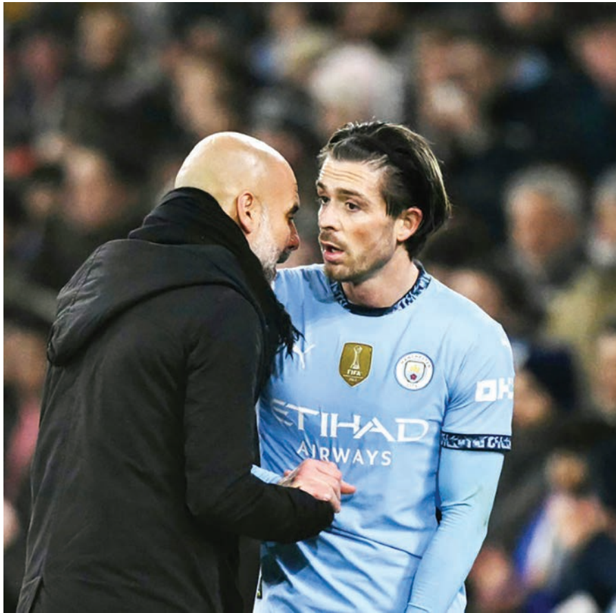
El entrenador del Manchester City Pep Guardiola (izquierda) habla con su jugador Jack Grealish durante el partido de Champions contra el Real Madrid, el 11 de febrero de 2025 en Mánchester.

En la misma línea, el técnico Pep Guardiola se mostró autocrítico y reconoció que el equipo aún no ha alcanzado el nivel de estabilidad necesario para competir al más alto nivel en Europa. “Para mí sería fácil culpar a un jugador concreto. Es ri-