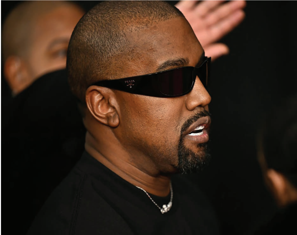
Kanye West está de nuevo en el centro de la polémica, esta vez por que el sitio web de una de sus empresas vendía camisetas con una esvástica.

dores que había filmado el anuncio en un iPhone y los invitó a visitar su por-