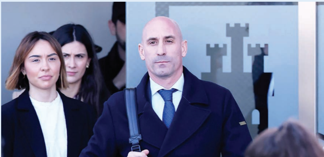
Luis Rubiales sale del tribunal que le juzga por el beso no consentido que dio a la jugadora Jenni Hermoso, el 3 de febrero de 2025 en San Fernando de Henares, cerca de Madrid.