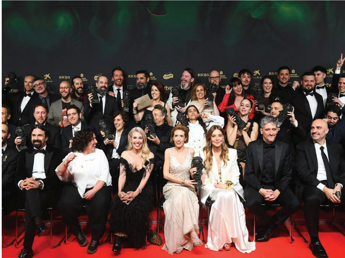
Los laureados de los premios Goya posan el 8 de febrero de 2025 en la ciudad española de Granada.

De todas maneras, la película ganó solo otro Goya, pese a haber llegado con 13 nominaciones,