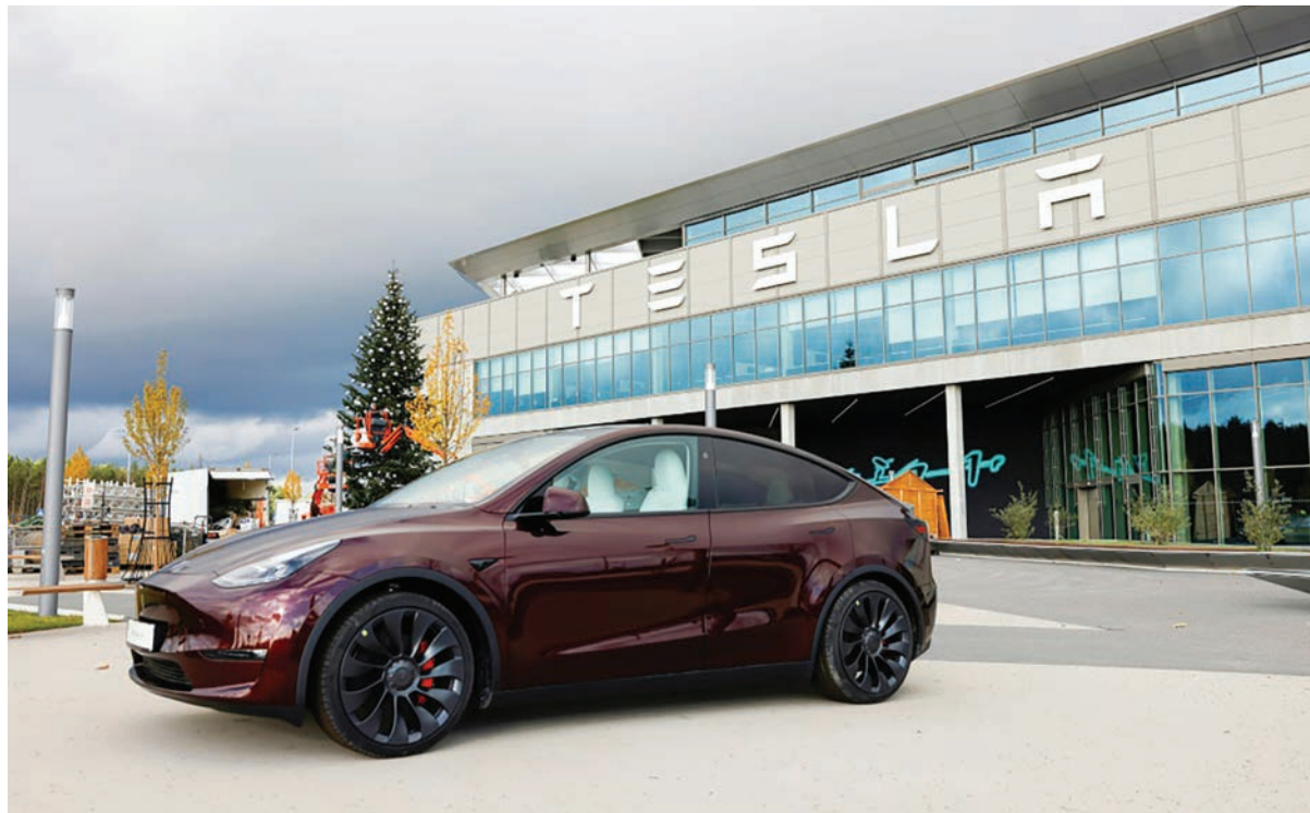
Un automóvil de Tesla permanece estacionado ante la fábrica de la marca estadounidense en Gruenheide, cerca de Berlín, el 20 de noviembre de 2024 al este de Alemania.

Musk ya solía estar en el centro del foco mediático,