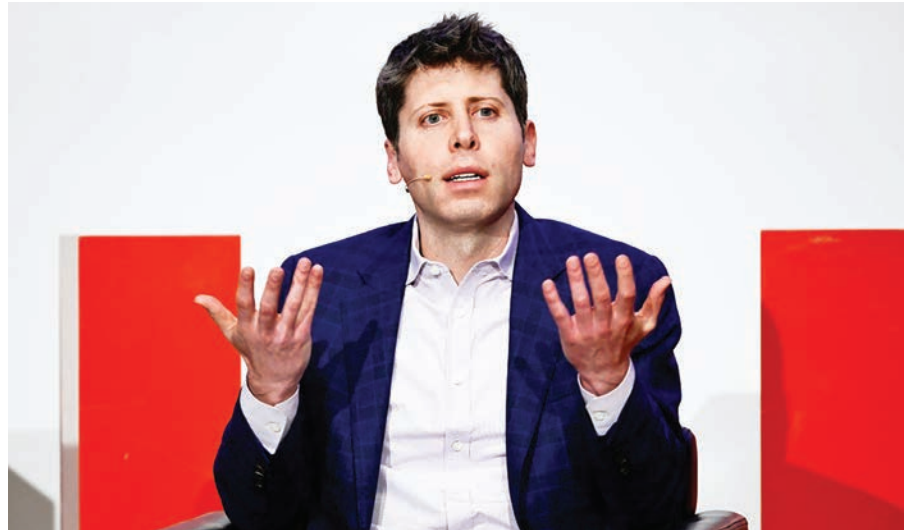
El director de OpenAI, Sam Altman, habla en una conferencia en Berlín, el 7 de febrero de 2025.

ha hecho ajustes en su estructura organizativa. En diciembre de 2024, anunció su plan para inscribirse como una entidad de beneficio público, con el propósito de equilibrar los intereses de los accionistas, las partes interesadas y el público en general. Bajo esta nueva