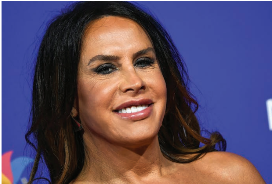
La actriz española Karla Sofía Gascón , en la entrega de los premios del Festival Internacional de Cine de Palm Springs, en California (EEUU), el 3 de enero de 2025.

El mensaje, en el que vuelve a pedir “disculpas a todos los que han sido heridos en el camino”, lo acompañó con una foto de Audiard y el equipo