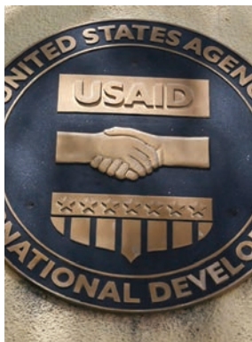
Logotipo de USAID, en la oficina de la agencia en Tegucigalpa, capital hondureña.

Su oficina había advertido que más de 480 millones de dólares en asistencia alimentaria es-