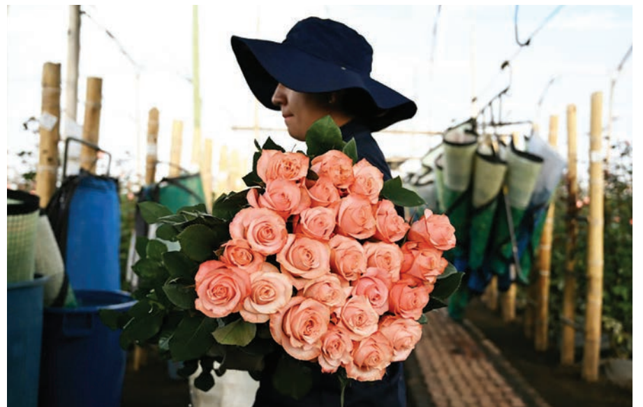
Una trabajadora arregla flores para su exportación en ‘Flores de los Andes’, en Bogotá, el 31 de enero de 2025.

Si bien Petro insiste en la necesidad de voltear la mirada a otros mercados, para los floricultores es imposible encontrar un cliente que celebre con tanto fervor el día de los enamorados. Para esta fecha los estadounidenses demandan miles