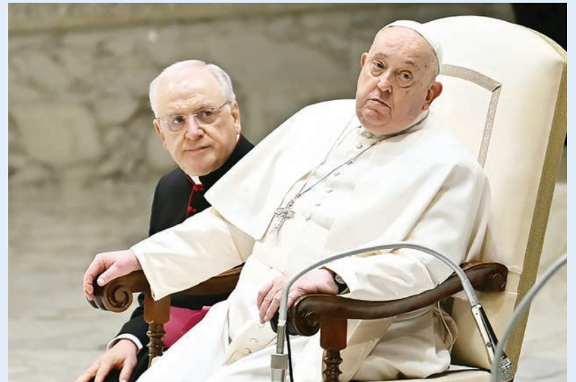
El papa Francisco, durante la audiencia general semanal ofrecida el 12 de febrero de 2025 en el Vaticano.