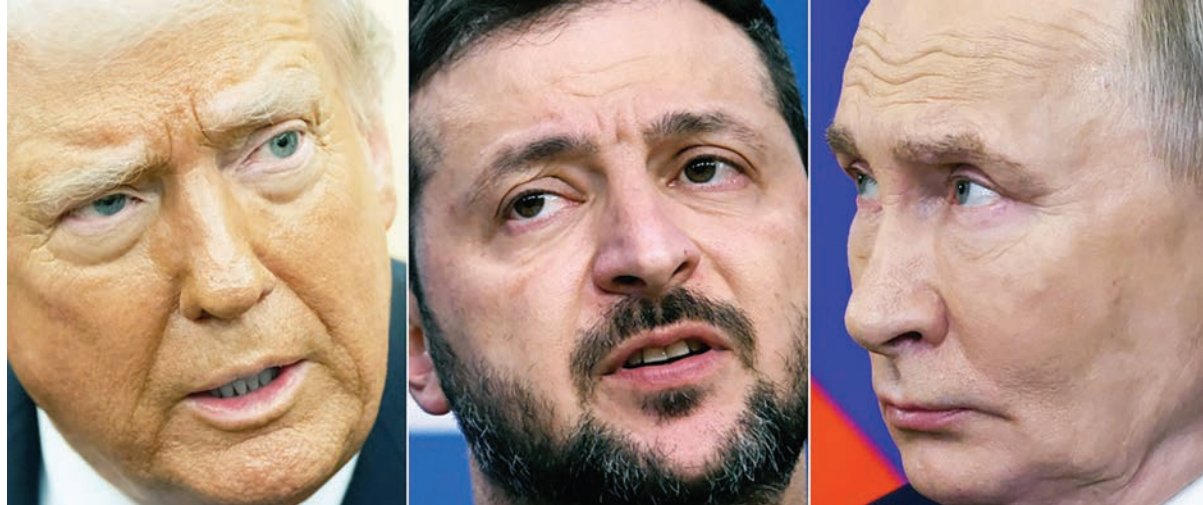
Una combinación de imágenes de archivo de los presidentes de EEUU, Donald Trump (izq.); Ucrania, Volodimir Zelenski (c); y Rusia, Vladimir Putin.

“Queremos detener las millones de muertes que están ocurriendo en la Guerra con Rusia/Ucrania. El presidente Putin incluso utilizó mi muy fuerte lema de campaña, ‘SENTIDO COMÚN. Ambos creemos firmemente