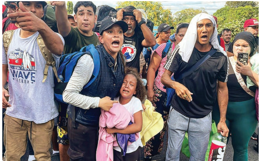
Migrantes discuten con policías panameños en la frontera entre Panamá y Costa Rica el 11 de febrero de 2025.