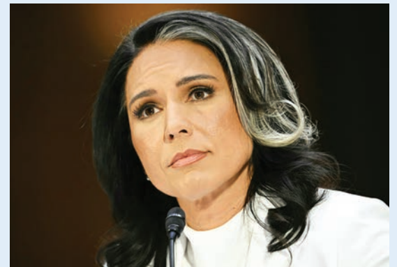
Tulsi Gabbard en una audiencia ante un comité del Senado estadounidense para confirmar su nombramiento como directora del servicio de inteligencia nacional, en Washington, el 30 de enero de 2025.

La ex teniente coronel fue criticada por hacerse eco de los argu-