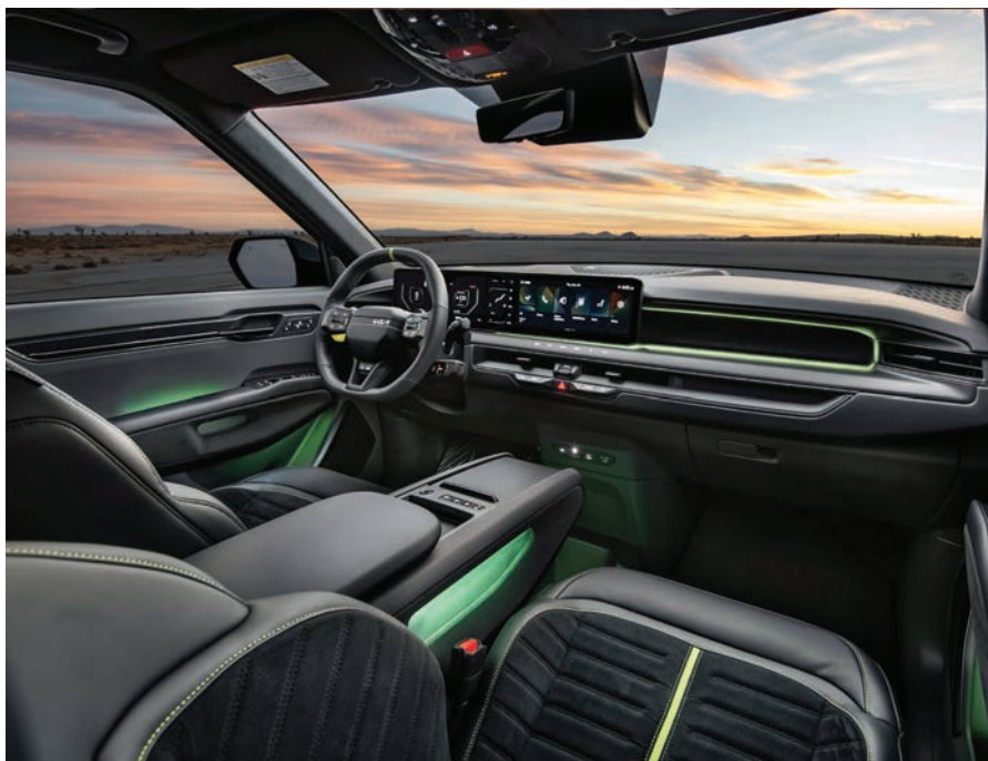
El SUV totalmente eléctrico de tres filas de Kia ofrece una combinación ganadora de autonomía, estilo y comodidad.