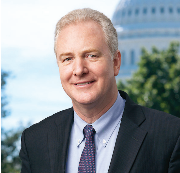
Chris Van Hollen calificó las acciones del equipo de Trump, incluyendo a Musk, como “ilegales” y dijo que la nación está “experimentando una crisis constitucional.”