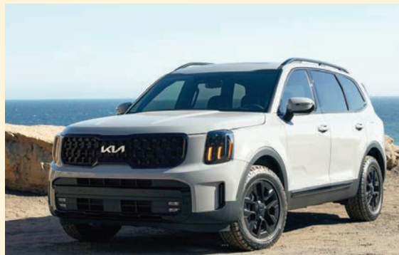
El Kia Telluride es reconocido como el “Mejor SUV Mediano” por sexto año consecutivo, estableciendo un récord en KBB por la mayor cantidad de victorias en esta categoría para un mismo modelo.

Los editores de Kelley Blue Book destacaron una vez más la atractiva combinación de precio, potencia