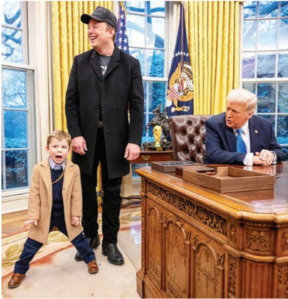
Elon Musk, director ejecutivo de Tesla y SpaceX, con su hijo X Æ A-XII, junto al presidente estadounidense Donald Trump en el despacho oval de la Casa Blanca en Washington, el 11 de febrero.