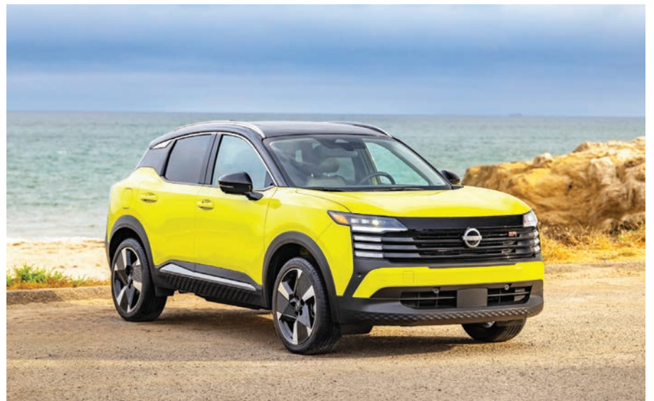
Entre las características adicionales disponibles se incluyen un techo panorámico, asientos delanteros calefaccionados, encendido remoto del motor, un sistema de audio Bose® con 10 altavoces y un volante calefaccionado.

El Kicks 2025 también está cubierto por la conveniencia del programa Nissan Maintenance Care,