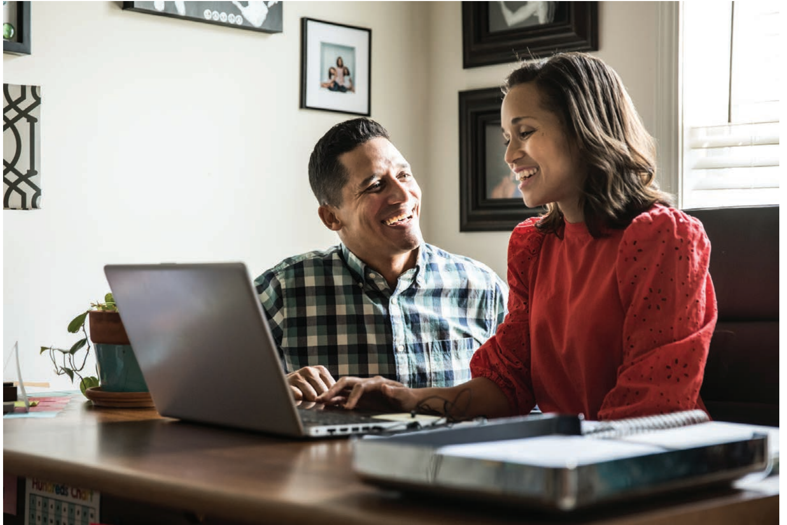
Es importante conocer las señales de una estafa y proteger siempre tu información personal.

Los estafadores pueden hacerse pasar por bancos, empresas de servicios públicos y agencias gubernamentales para engañar a los consumidores y quitarles su dinero. Los estafadores se pondrán en contacto con las víctimas por teléfono o mensaje de texto, exigiendo dinero para garantizar que no ocurra algo en sus cuentas. A veces, dicen que necesitan la información de tu cuenta para investigar actividades sospechosas. Te "embaucan" o te engañan suplantando la información del identificador de llamadas de tu banco o con enlaces de sitios web que parecen legítimos. Si alguien te llama y te dice que hay algo mal en tu cuenta, cuelga y llama a tu banco directamente al número que aparece en el reverso de tu tarjeta de débito o crédito.