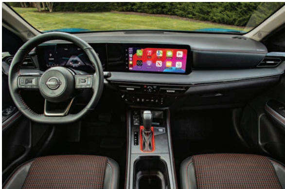
Sistema de infoentretenimiento con pantalla táctil de 7 pulgadas y Bluetooth.

Por primera vez, cada versión del Kicks está