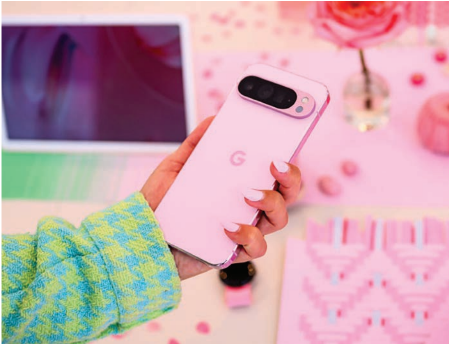
El nuevo teléfono Pixel, presentado por la compañía Google el 13 de agosto de 2024 en Mountain View, California (EEUU)

parativa importante en la competencia por la IA: los datos de los usuarios, que puede recoger gracias a sus servicios ultra utilizados en el mundo como su sistema móvil Android o aplicaciones como YouTube, Google Maps y Gmail. Con estos datos, un asistente que funciona en base a IA podría ser accesible en todo momento y capaz de ejecutar muchas tareas en nombre del usuario. Gemini, el principal modelo de IA de Google puede proponer "ayuda personalizada" para "acceder a información en el correo, Gmail, el calendario y mucho más", dijo Shenaz Zack, una directora de los modelos Pixel, durante una conferencia de prensa. A pesar de su imperio