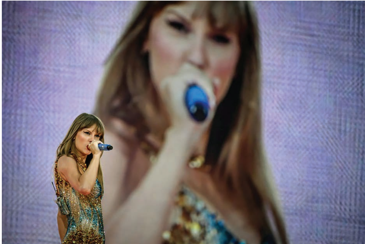
La cantante Taylor Swift se presenta el 2 de junio de 2024 en Decines-Charpieu, en el este de Francia.

Tres supuestos seguidores de EI fueron detectados con ayuda de la inteligencia