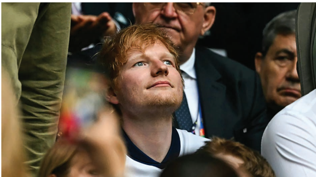
Ed Sheeran, accionista minoritario de Ipswich Town.

“Estoy muy feliz por haber adquirido un pe-