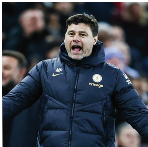
Pochettino ha acordado los términos para convertirse en el nuevo entrenador de la selección nacional de Estados Unidos.

Pochettino, de 52 años, llegaría en un momento en el