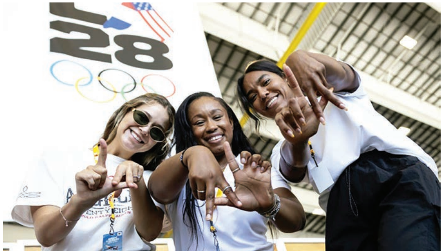
Californianas reciben a la bandera olímpica en el aeropuerto de Los Ángeles, el 12 de agosto de 2024.

"Evidentemente tenemos que asegurar que estamos listos y preparados para hacer frente a situaciones como los posi-