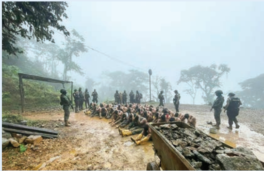
Ataque entre integrantes de grupos armados organizados que causó el deceso de 5 personas y 3 heridos, en una mina del cantón.