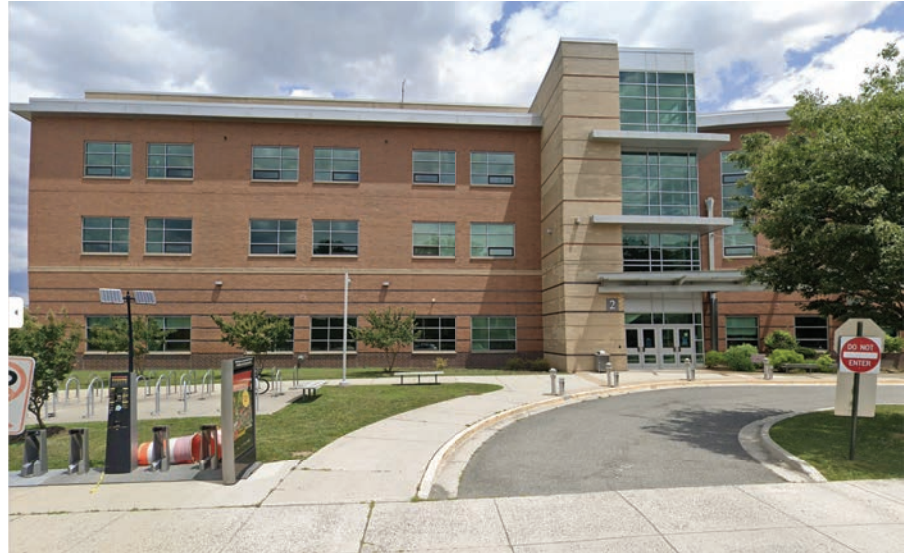
Escuela en Arlington Virginia Washington-Liberty High School.

el día escolar. Esta medida busca minimizar las distracciones y asegurar un ambiente de aprendizaje más efectivo. En las escuelas preparatorias, se permitirá que los estudiantes mantengan sus teléfonos en modo silencioso y fuera de uso solamente durante las clases. No obstante, tendrán la posibilidad de usar sus teléfonos entre clases y durante el almuerzo, lo cual se considera un equi-