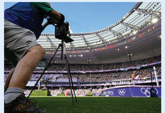
El regatista peruano Stefano Peschiera posa con su medalla de bronce el 7 de agosto de 2024.

La investigación comenzó el 28 de julio tras el robo de una cámara valorada en 15.000 euros de la empresa Beijing Momenta Media y la denuncia del atleta estadounidense Ben