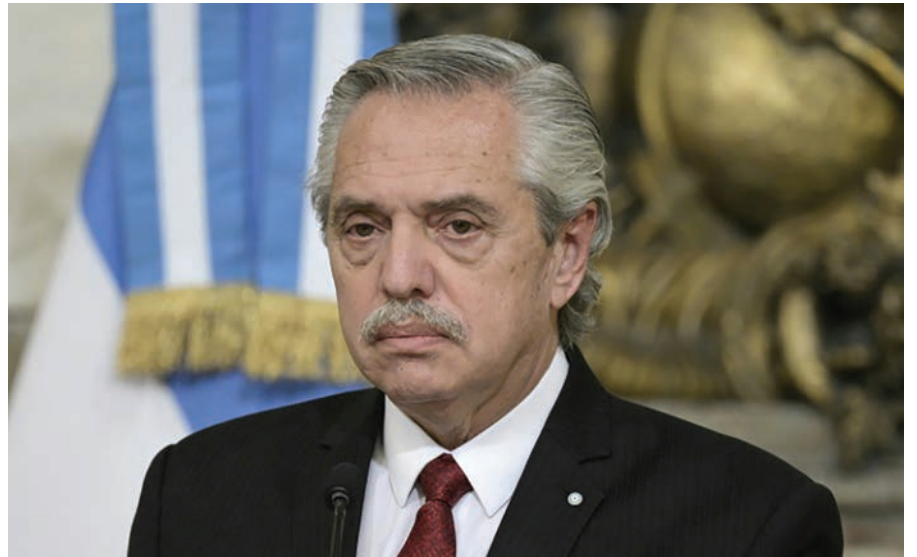
El expresidente de Argentina Alberto Fernández en al Casa Rosada el 25 de abril de 2023

Tuvo lugar el mismo día que se filtró a la prensa la denominada “foto de Olivos”, donde Fernández y Yáñez son vistos con varias personas en un festejo de cumpleaños en la resi-