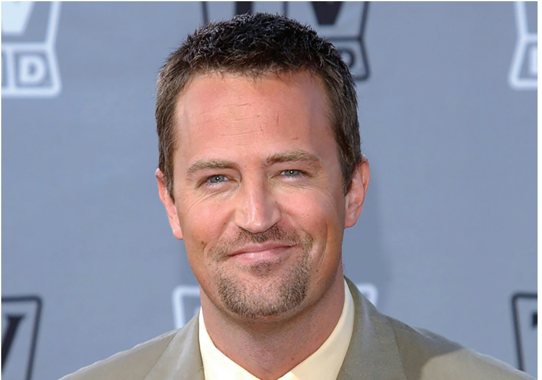
El actor Matthew Perry, visto aquí en 2003, murió el año pasado por una sobredosis de ketamina, según las autoridades judiciales.