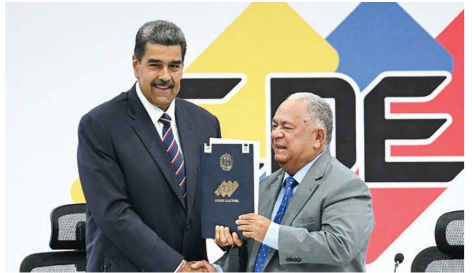
El mandatario venezolano, Nicolás Maduro, estrecha la mano del jefe del Consejo Nacional Electoral (CNE), Elvis Amoroso, durante su proclamación en la sede del CNE en Caracas el 29 de julio de 2024, un día después de las elecciones presidenciales

Maduro fue proclamado ganador con el 52% de los votos, pero la oposición, encabezada por María Corina Machado, sostiene que hubo fraude y reclama la victoria de su candidato, Edmundo González Urrutia. Las