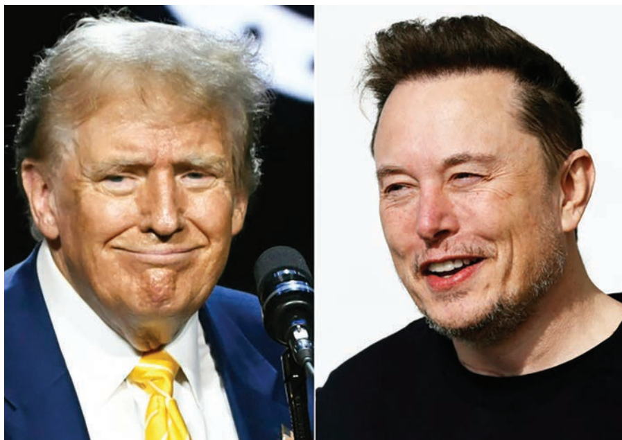
Combo de imágenes creado el 12 de agosto de 2024 del expresidente de EEUU Donald Trump (i) y el magnate de la tecnología Elon Musk

Hasta ahora, Trump no había tomado el control de su antiguo canal de comunicación favorito y seguía utilizando su propia plata-