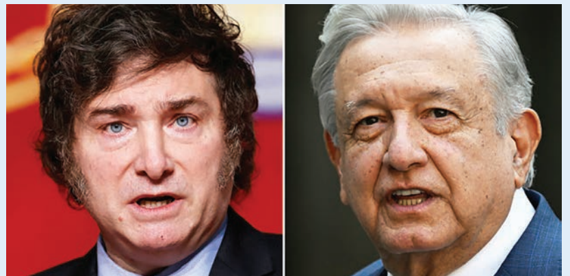
Los presidentes de Argentina, Javier Milei (izq.), el 21 de junio en Madrid, y de México, Andrés Manuel López Obrador, el 11 de junio en Ciudad de México.