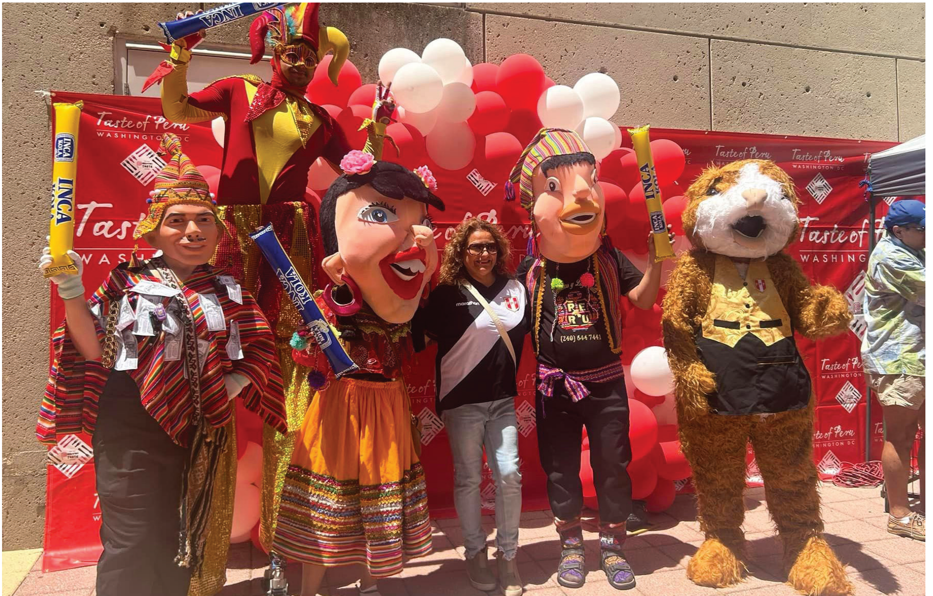
La familia fue a divertirse a lo grande al taste Of Peru DC