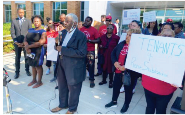
Miembros de la organización CASA llegaron a la sede del consejo del condado de Prince George’s, para expresar sus cuestionamientos al proyecto de estabilización de la renta presentado el martes.

Según el proyecto legislativo, es posible que los propietarios que no aumentan los alquileres con el costo de la inflación puedan acumu-