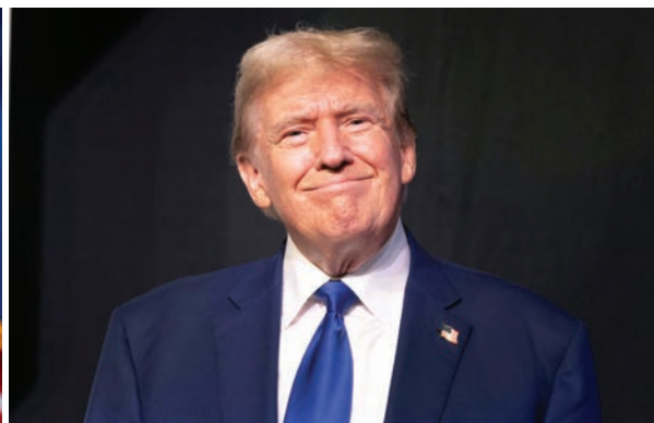
Nikki Haley (izq.) derrotó a Donald Trump en las primarias presidenciales republicanas de DC el martes 4 de junio. Biden también lo logró en las primarias demócratas el mismo día.