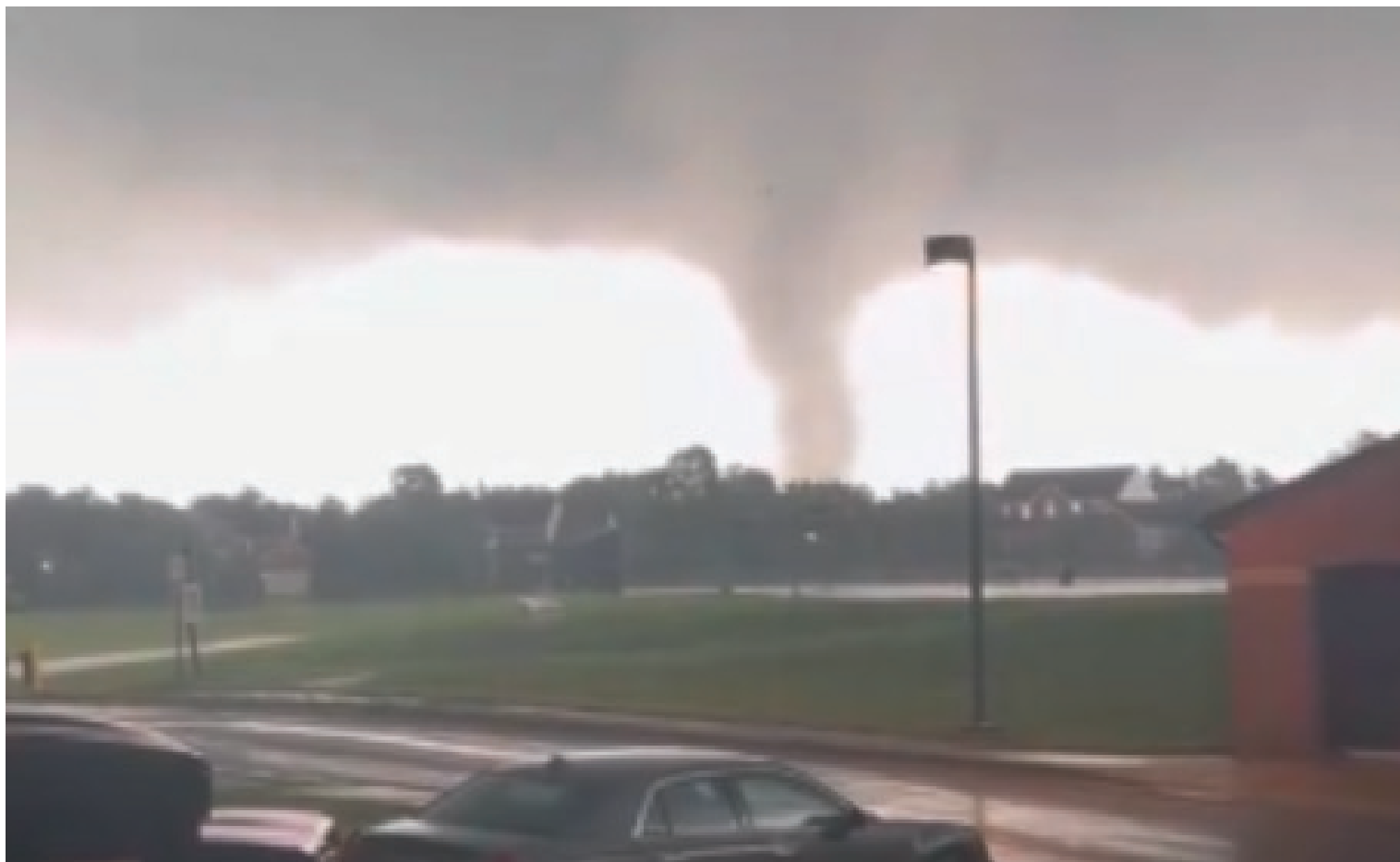
Al fondo se puede apreciar uno de los tornados destructivos que tocaron suelo en Gaithersburg, provenientes del condado de Loudoun, Virginia.

El camino de los daños comenzó al oeste en Leesburg, en Virginia, e incluye