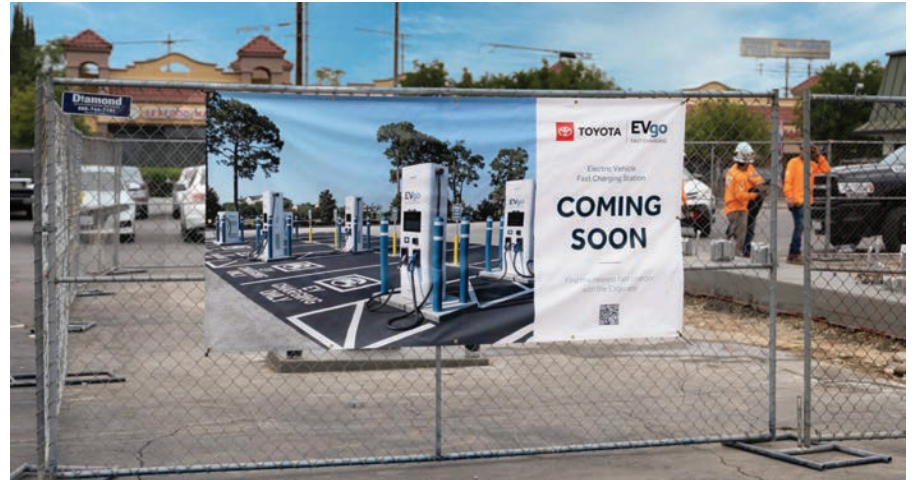
Vista de la futura estación de carga eléctrica en Baldwin Park, una comunidad ubicada en California.