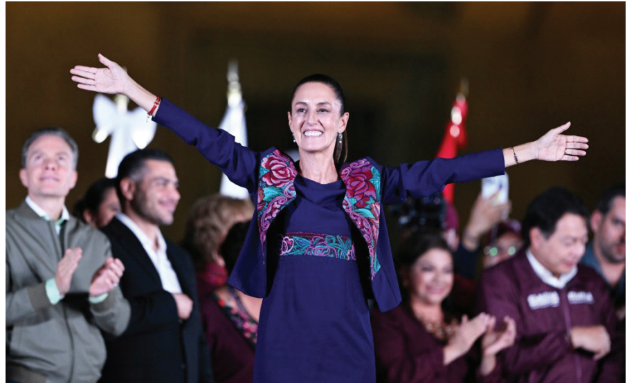
Claudia Sheinbaum, vencedora por amplio margen de la elección presidencial en México, celebra su victoria la madrugada del lunes 3 de junio en la capital mexicana.

En un intento de revitalizar la economía dolarizada, en 2021 Bukele hizo a El Salvador el primer país del mundo donde el bitcoin es de curso legal. Pero pocos salvadoreños lo usan.