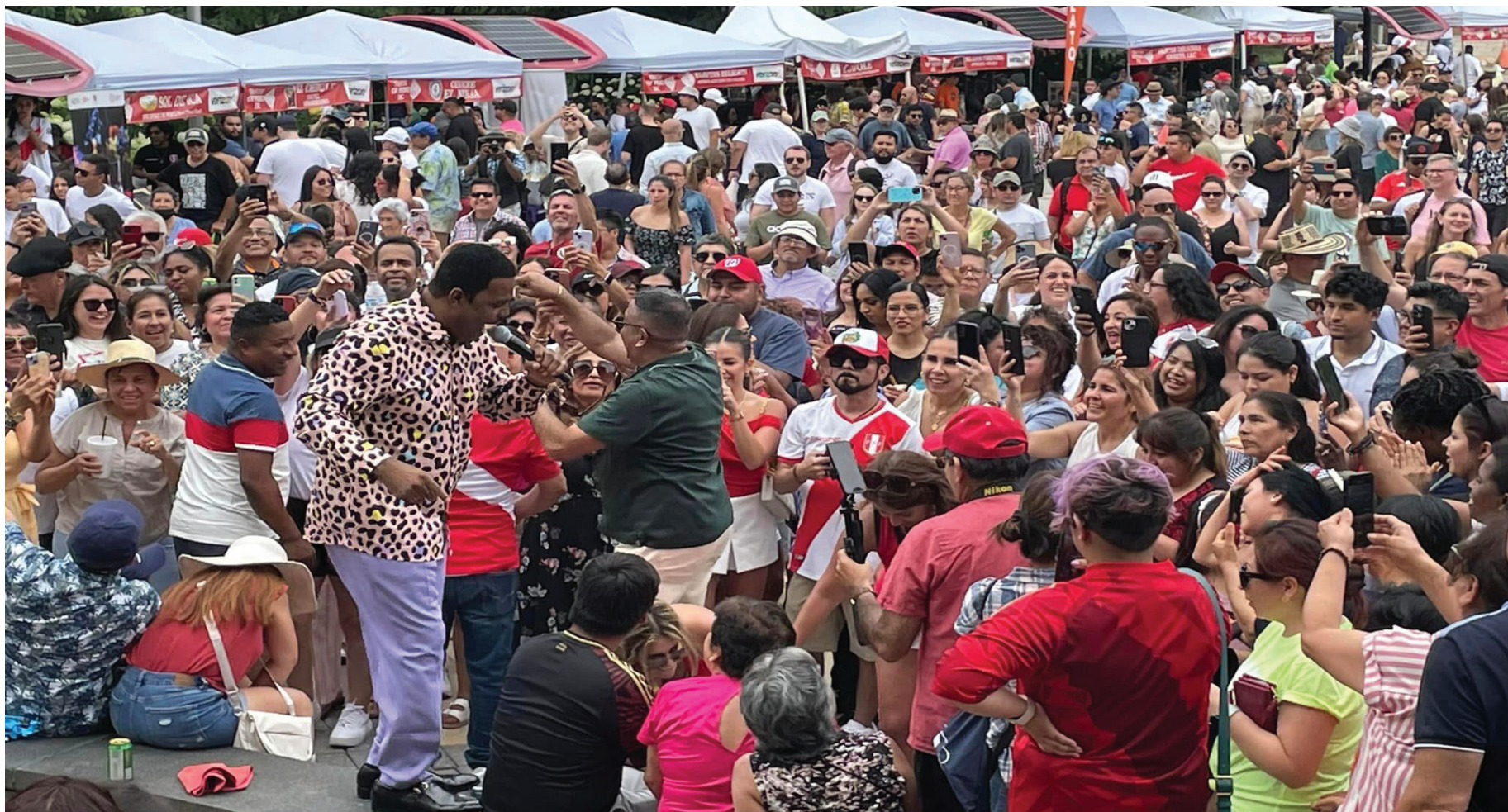
La feria gastronómica Taste of Perú-Washington DC 2024 congregó a cientos de personas de la diáspora peruana.