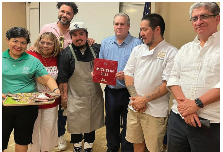
El Embajador del Perú Alfredo Ferrero Diez Canseco participó activamente del Taste Of Perú Washington DC.