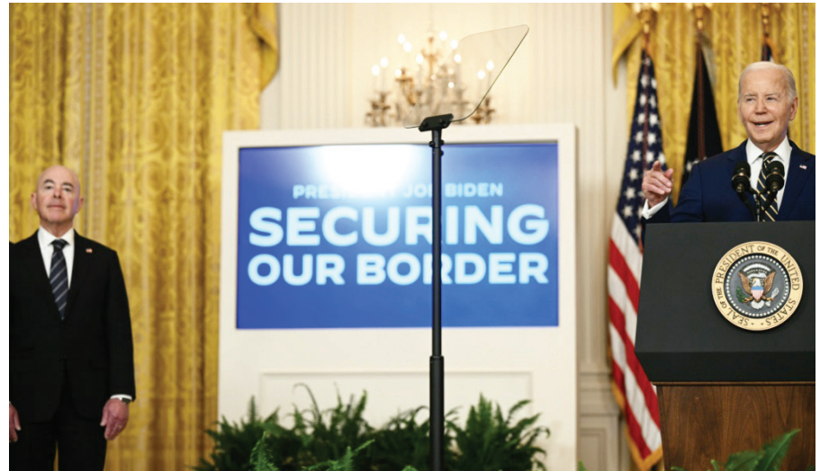
El presidente Joe Biden , habla sobre las medidas para reforzar la seguridad en la frontera con México, acompañado por su secretario de Seguridad Interior, Alejandro Mayorkas (izq), el 4 de junio en la Casa Blanca.