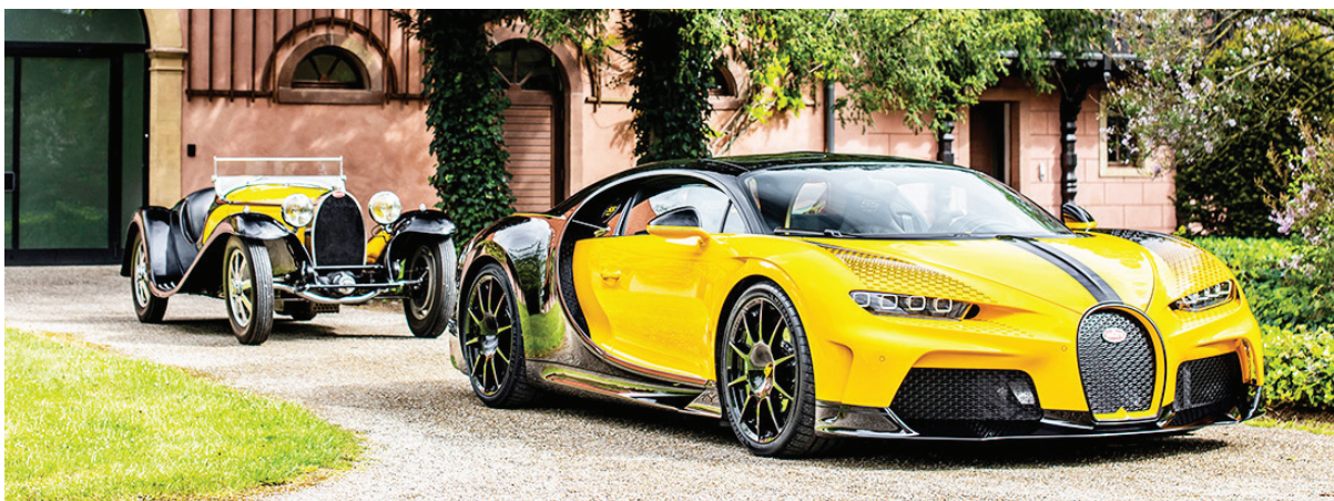
Bugatti Chiron 55 1 of 1, la nueva creación de Sur Mesure, exhibe toda su prestancia superdeportiva.

Uno de los detalles más sobresalientes del Type 55 era su carrocería biplaza, diseñada por Jean Bugatti, que marcó el inicio de la categoría Super Sport en