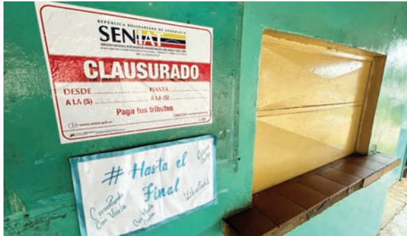
Fachada del restaurante clausurado en el caserío Corozopando, estado de Guárico, Venezuela, luego de que la opositora María Corina Machado desayunara en el lugar.

“Hasta el final”, reza un pequeño cartel escrito