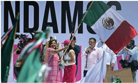
Xóchitl Gálvez, la candidata presidencial opositora, ondea la bandera mexicana en un mitin en la capital del país. Esperaba dar la gran sorpresa.

Física y exalcaldesa de Ciudad de México (2018-2023) de origen judío, Sheinbaum aventaja en