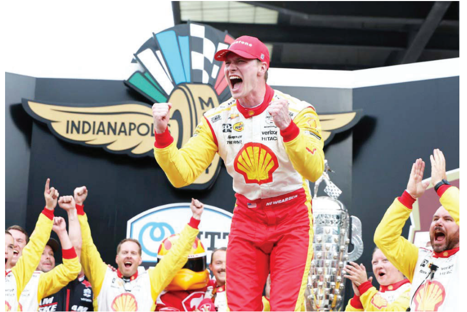
Josef Newgarden celebra su victoria del domingo en las 500 Millas de Indianápolis, la cita más famosa del calendario de la serie IndyCar.

El estadounidense Alexander Rossi ocupó el cuarto lugar y el español