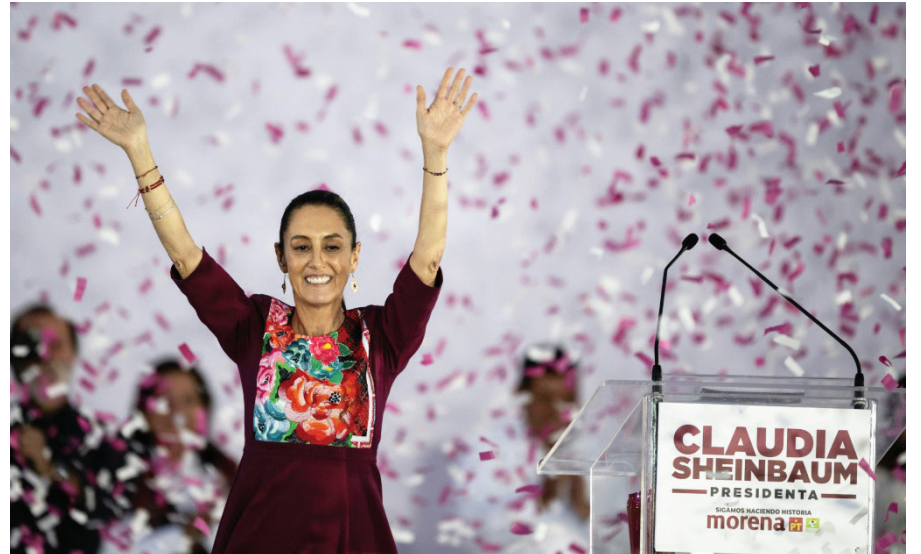
La candidata presidencial oficialista mexicana Claudia Sheinbaum es la gran favorita para suceder al presidente Andrés Manuel López Obrador.

En tercer lugar está Jorge Álvarez Máynez (12%), exdiputado centrista de 38 años, que retomó actividades el sábado tras la reciente muerte de nueve personas al colapsar un escenario durante uno de sus mítines.