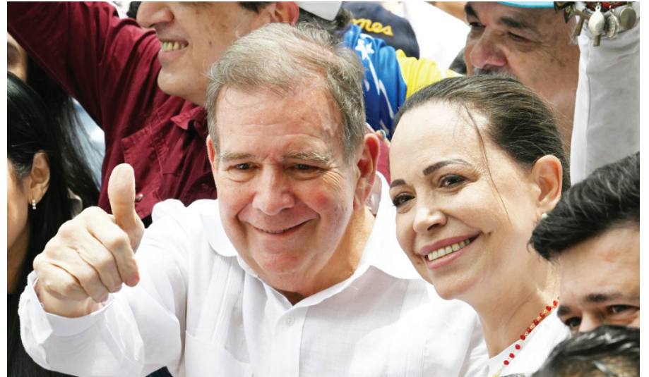
Edmundo González Urrutia es el candidato presidencial en Venezuela por la Plataforma Unitaria, que agrupa a la oposición contra Nicolás Maduro. Aquí con la líder María Colina Machado, inhabilitada para ser candidata y el alma de la campaña opositora.

“Aquí el único que garantiza la paz se llama Nicolás Maduro”, dijo el propio mandatario de 61 años, con una popularidad que