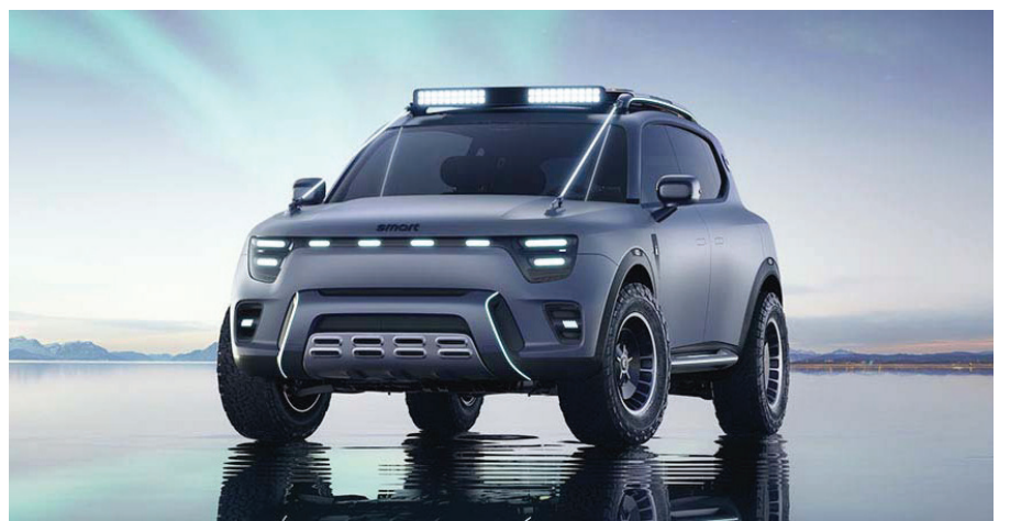
El nuevo smart Concept #5 en el momento de ser presentado en el Auto Show de Beijing.

El smart #5 Concept incluirá un sistema de infoentretenimiento basado en la Inteligencia Artificial, el cual consta de dos pantallas OLED, una en el centro del tablero y la otra frente al asiento del pasajero delantero. El cerebro