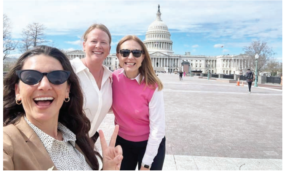
El complejo del Capitolio , los museos y el Mall Nacional son algunos de los atractivos de la ciudad de Washington que más atraen a millones de turistas nacionales, y las autoridades esperan que aumente el número de visitantes internacionales con otros atractivos, incluyendo grandes festivales.

Al respecto, dijo que la ciudad ya tiene presencia de marketing en Londres, así como en lugares como Nueva