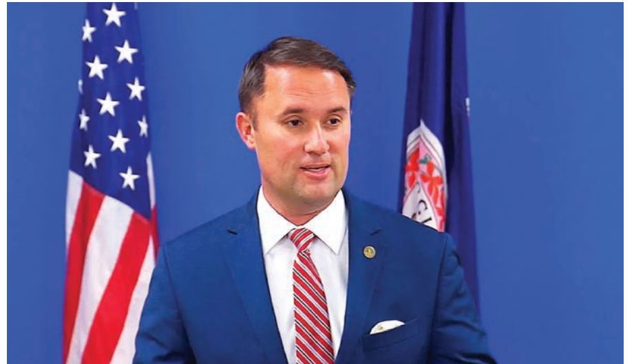
El fiscal general de Virginia se sumó a una coalición de fiscales del país para impugnar varias medidas federales para reducir las emisiones contaminantes.

Pollard, uno de los principales partidarios de la reducción de las emisiones de los automóviles, defien-