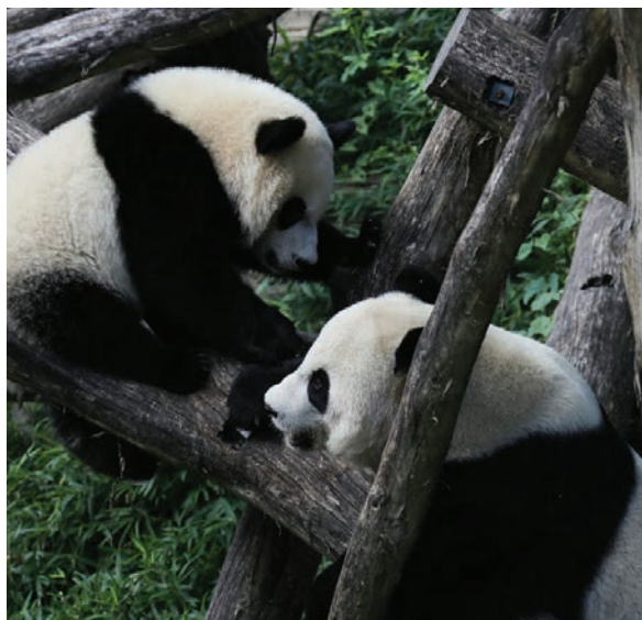
Dos de los osos panda que por años fueron admirados en el Zoológico de Washington siguen en China. Pero en pocos meses, en diciembre, la nación oriental enviará dos nuevos pandas gigantes para reemplazarlos: Qing Bao y Bao Li.

El miércoles, Pekín confirmó que entregará de nuevo dos pandas gigantes al Zoológico Nacional de Washington DC a finales de año, hecho que fue anunciado por la primera dama de los Estados Unidos, Jill Biden, y funcionarios de la administración, en un mensaje sorpresa que marca una nueva era de “diplomacia panda”