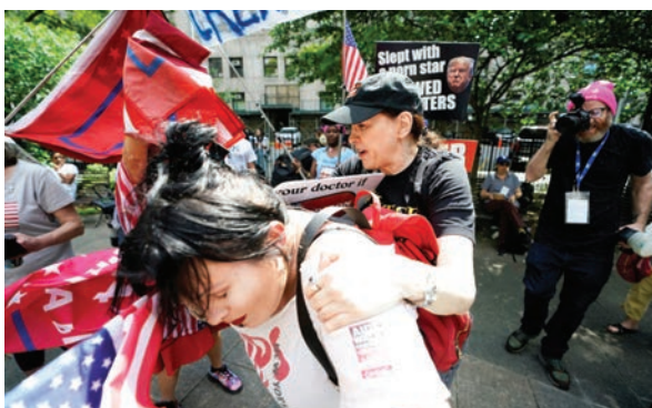
Manifestantes a favor y en contra de Donald Trump son llevados por la policía frente al tribunal donde el expresidente republicano era juzgado el jueves 30 de mayo.

La Escuela Carlos Rosario no discrimina por motivos de raza, color, origen nacional, sexo, discapacidad, edad u otra condición protegida en sus programas o actividades.