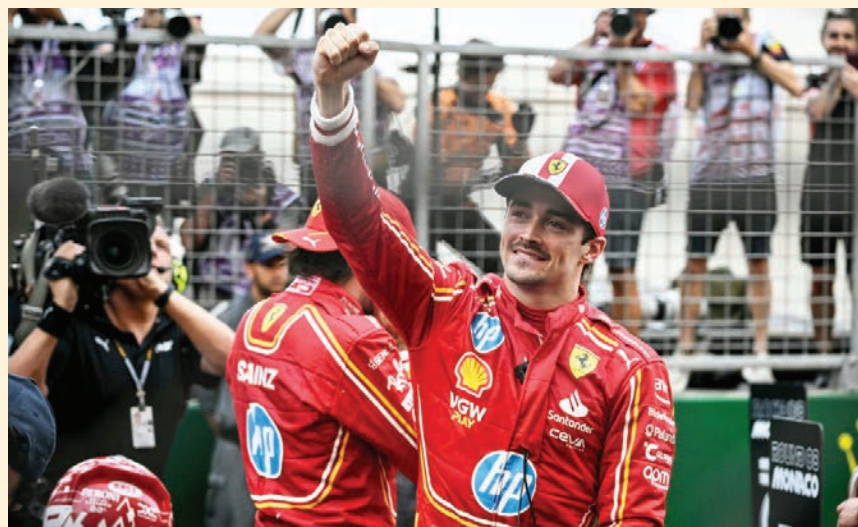
El piloto monegasco de Ferrari, Charles Leclerc, celebra con el puño en alto su victoria en el Gran Premio de Mónaco de Fórmula 1, el domingo 26 de mayo en Mónaco.

Con esta victoria, su primera de la temporada, Leclerc confirma su segunda posición en el Mundial de pilotos (138 puntos), por detrás del holandés Max Verstappen (169 puntos), quien disputó un discreto Gran Premio. Salió de la sexta posición y cruzó la línea de meta en esa misma