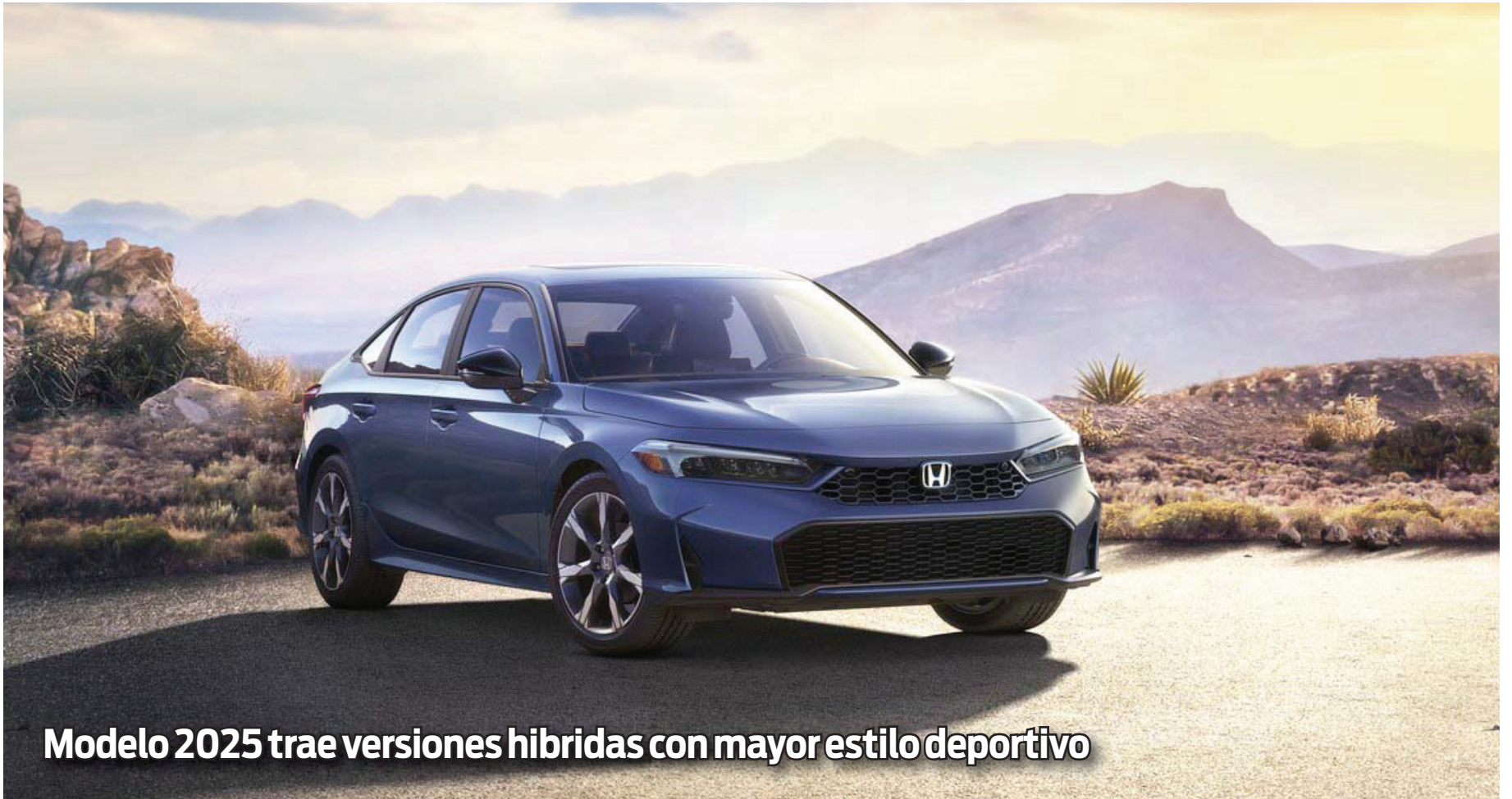
Modelo 2025 trae versiones híbridas con mayor estilo deportivo