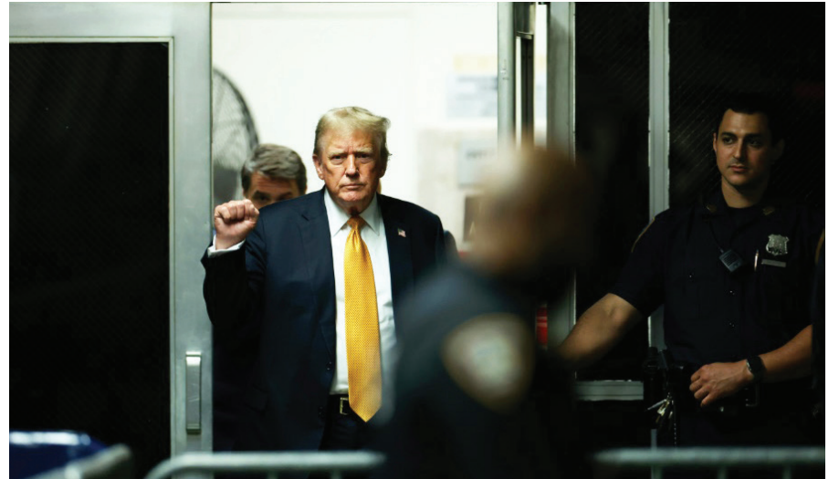
El expresidente Donald Trump hace un gesto, mientras un jurado de 12 miembros delibera en el proceso que se le seguía en una corte de Nueva York. Al final, el jurado lo encontró culpable de 34 cargos.

También enfrenta cargos en Florida por llevarse enormes cantidades de documentos clasificados tras abandonar la Casa Blanca.