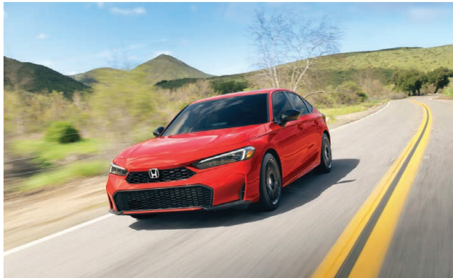
El estilo exterior de cada Honda Civic 2025 -aquí en su versión sedán Sport Touring- presenta una fascia delantera y parrilla más desafiantes.