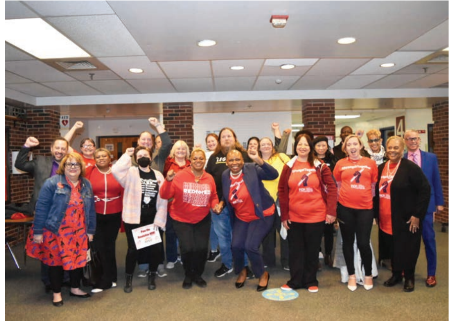
Maestros y personal de las escuelas públicas de Fairfax, Virginia, celebran el acuerdo alcanzado el martes 28 de mayo.

“Estoy encantada de que no sea sólo la licencia de maternidad, sino también la de paternidad, porque sabemos que el tiempo es muy importan-