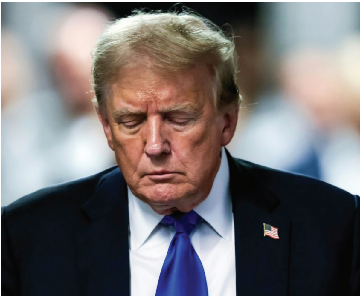
El expresidente y candidato presidencial republicano Donald Trump sale de la sala del tribunal después de ser declarado culpable en su juicio penal en el Tribunal Penal de Manhattan, en la ciudad de Nueva York, el 30 de mayo.

Washington busca superar récord de 26 millones de visitantes logrado en 12 meses.