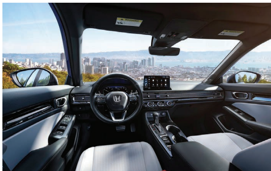
La nueva versión del Civic Sport Touring Hybrid de gama alta trae la primera integración de Google para una conectividad perfecta mientras viaja.

El Sport Touring Hybrid agrega asientos de cuero, un sistema de audio premium Bose de 12 bocinas y tecnología intuitiva, que incluye una pantalla táctil más grande de 9 pulgadas con compatibilidad inalámbrica con Apple CarPlay y Android Auto y un cargador inalámbrico para teléfonos inteligentes.