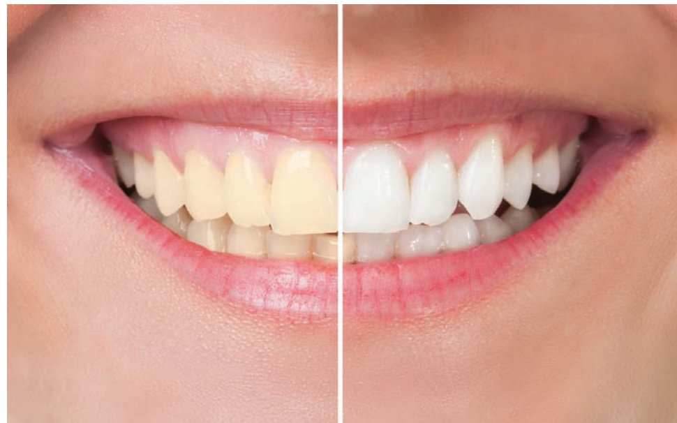
El blanqueamiento remueve tanto manchas profundas como de la superficie.

■ Blanqueamiento en consultorio: Las citas presenciales suelen requerir de una visita al consultorio. El dentista aplicará un gel protector sobre las encías o un escudo de caucho para protegerlas. Después, se aplicará el blanqueador. Podría usarse una luz o laser especial a fin de mejorar la acción del agente