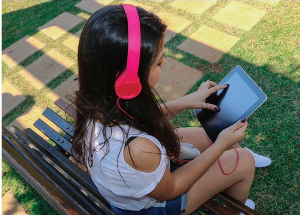
Uno de cada cinco adolescentes estadounidenses pasan más de 5 horas al día con los smartphones, tabletas, computadoras y videojuegos.