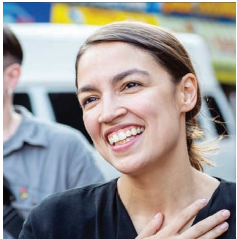
Alexandria Ocasio-Cortez se convirtió en la mujer más joven en ser electa para servir en el Congreso.

La Agenda de las Naciones Unidas para el Desarrollo Sostenible 2030 busca no dejar a nadie atrás, e incluye el objetivo específico