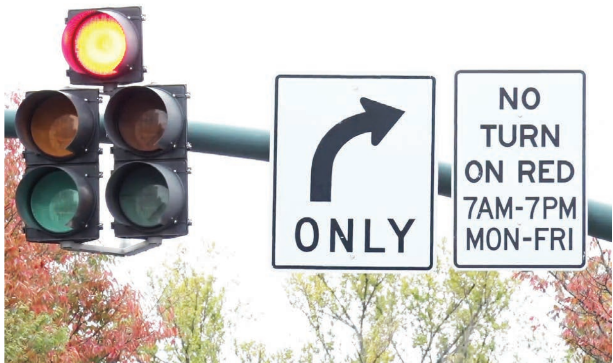
La iniciativa se pondrá en marcha en 100 intersecciones de la ciudad. Los ciudadanos podrán opinar sobre esta iniciativa con el DDOT hasta principios del próximo mes de febrero.