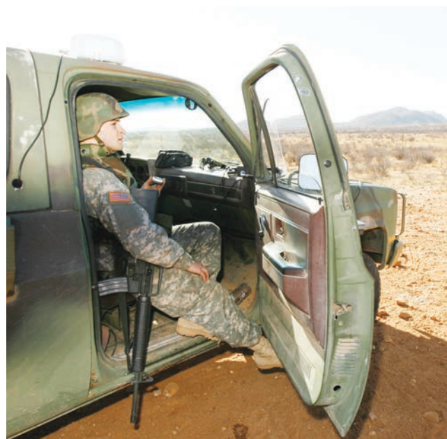
Para detener la inmigración ilegal el presidente Donald Trump ordena movilizar la Guardia Nacional.