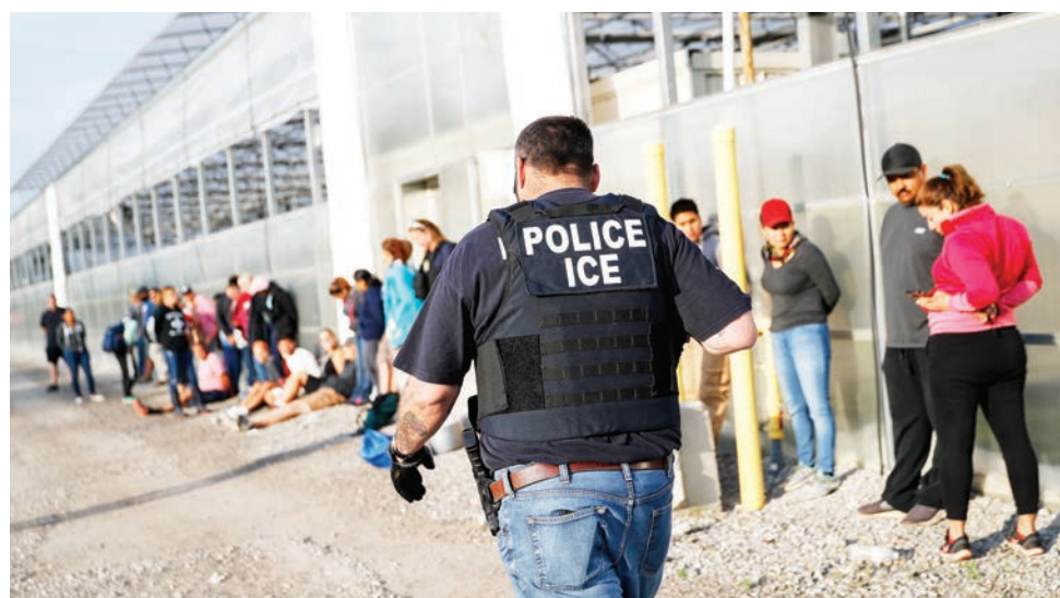
Un agente de ICE camina frente a los trabajadores arrestados el martes 5 en la empresa Corso's Flower and Garden Center, en Castalia, Ohio, donde se produjo la redada.