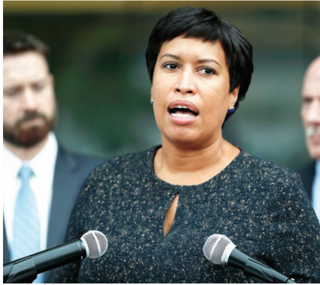
La alcaldesa Muriel Bowser llamó a continuar el trabajo municipal en su próximo periodo de cuatro años que se inicia el 2 de enero.

En DC hubo varios puestos en juego, donde la delegada Eleanor Holmes Norton sobrepasó los 185,500 votos (88%), mientras el fiscal general de Washington, Karl Racine, logró la votación más alta, 193,885. Ambos fueron por la reelección, al igual que el presidente del Concejo de la Ciudad, Phil Mendelson y los miembros del concejo