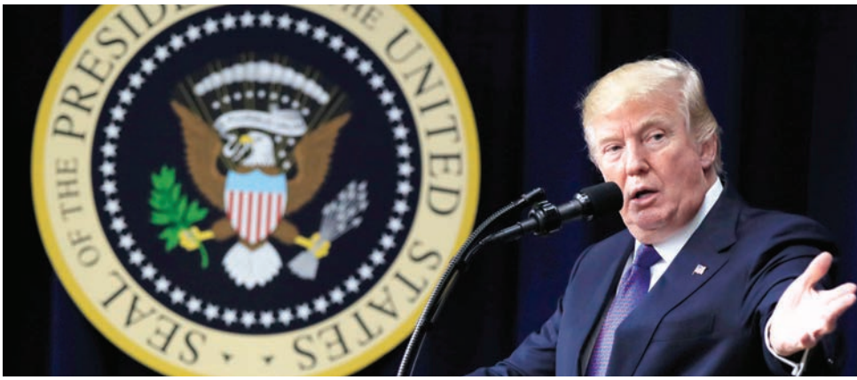
El presidente Donald Trump termina su segundo año de gobierno en medio de un cierre parcial de la administración y ya se dan las maniobras para una campaña por la reelección el 2020. ¿Lo conseguirá?

Con evidentes logros, especialmente económicos, como lo fueron los altos índices de empleo y el más bajo nivel de desempleo que se registran en un par de décadas en el país, el presidente Donald Trump está culminando su segundo año de gobierno con una similar polarización política a la del inicio de su administración.