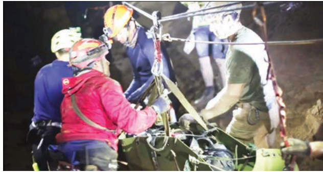
Comandos de la Navy SEAL rescatan a uno de los 12 niños y un profesor atrapados por más de dos semanas en una caverna en una provincia al norte de Tailandia.

Una audaz misión de rescate en las inundadas grutas de una laberíntica cueva tailandesa terminó con el rescate de los 12 muchachos y su entrenador de fútbol, concluyendo un drama de 18 días que segó la vida de un buzo y mantuvo en vilo a muchas personas en todo el mundo. "No sabemos si esto fue un milagro o algo científico o qué, pero lo cierto es que los 13 Jabañes Salvajes están fuera de la cueva", dijo la fuerza de operaciones especiales de la Armada tailandesa en alusión al nombre del equipo de fútbol. "Todos están a salvo", continuó.