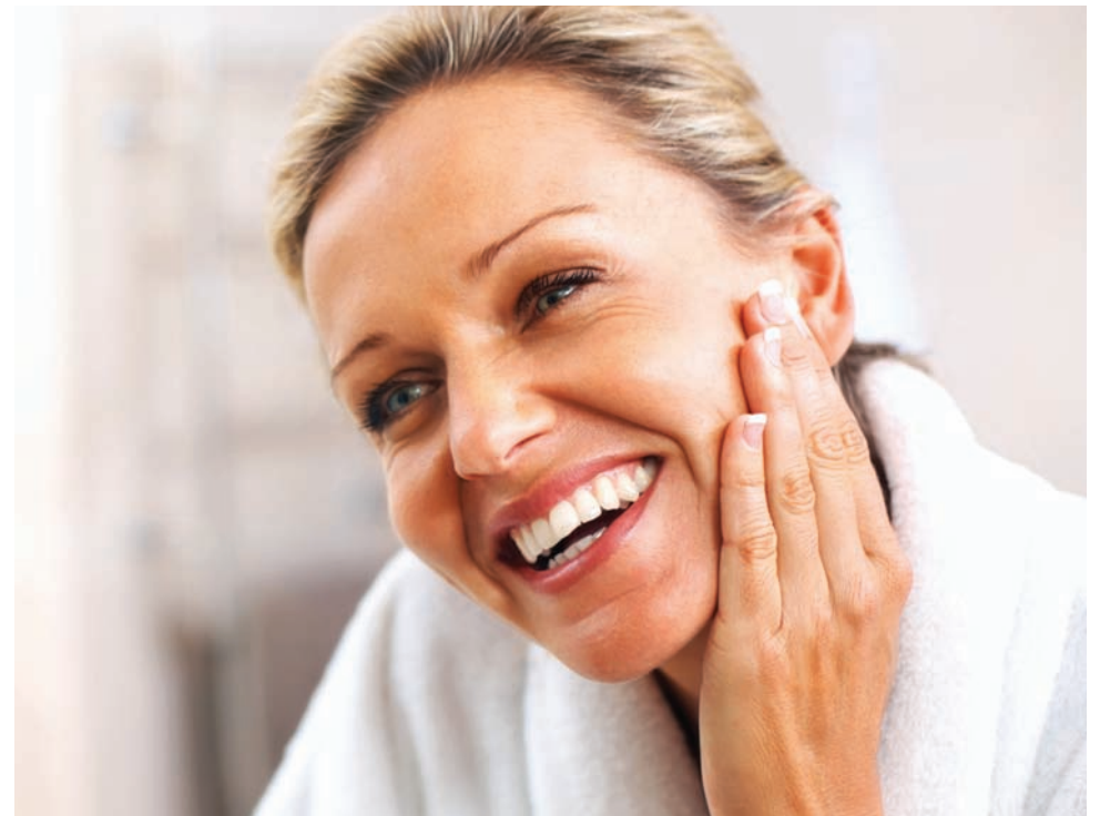
Durante el invierno la piel está expuesta a las bajas temperaturas, el viento y la calefacción, lo que hace que se pierda su nivel óptimo de hidratación.

Recuerde usar bloqueador también en invierno. Los rayos ultravioletas siempre están presentes.