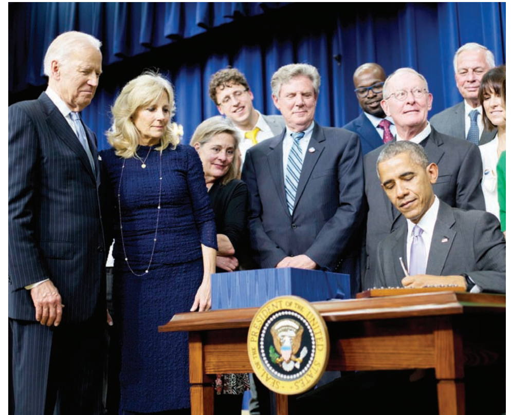
El presidente Obama firmó la ley, durante un acto en la Casa Blanca acompañado por su vicepresidente, Joseph Biden, y varios legisladores demócratas y republicanos.

de las beneficiadas por esta ley será la Administración de Medicamentos y Alimentos