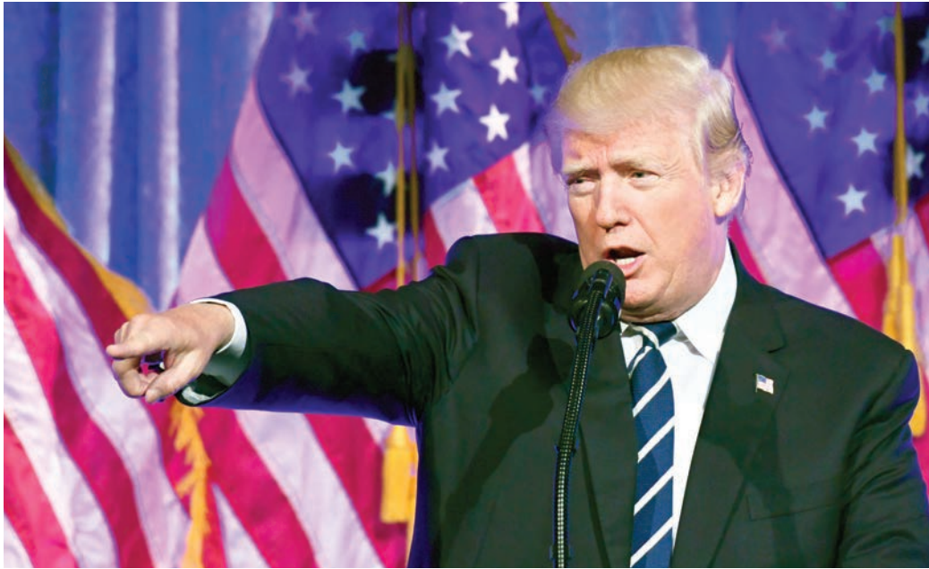
El presidente Donald Trump pronuncia un discurso en el restaurante Cipriani en Nueva York, elogiando la aprobación de su reforma fiscal en el Senado.

Trump celebró la aprobación del proyecto en Twitter, dando las gracias a McConnell y al presidente del Comité de Finanzas del Senado, Orrin Hatch, republicano por Utah. “¡Deseando