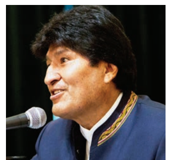
El presidente de Bolivia, Evo Morales.

Morales cumplirá 12 años en el poder en enero y las próximas elecciones presidenciales serán