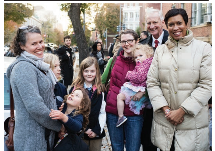
Muriel Bowser , alcaldesa de Washington, se reúne con residentes en un recorrido por las calles de la ciudad, antes de anunciar millonarios fondos para viviendas accesibles, a pesar de los obstáculos derivados de la reforma fiscal del gobierno.