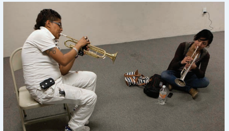
La Fundación Latin Grammy abre plazo para solicitud de becas. Los estudiantes de música preferiblemente de edades entre 17 y 24 años son elegibles.

Las solicitudes pueden obtenerse en LatinGRAMMYCulturalFoundation.com . Como parte