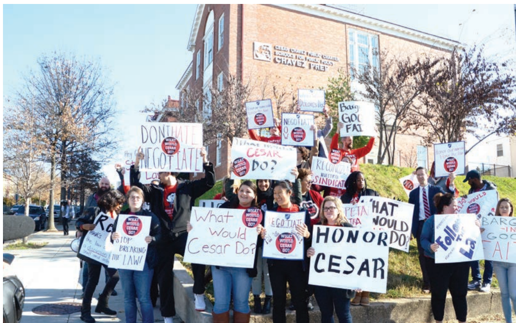
Con pancartas en mano, casi tres decenas de maestros y administrativos salieron el viernes a la hora de almuerzo para manifestarse en los alrededores de la escuela, ubicada en el noroeste de la ciudad.

César Chavez Prep Middle School ha sido la primera escuela del sistema charter en votar para formar un sindicato con la AFT. Según la federación, otras escuelas del área están sosteniendo conversaciones para unirse a las más de 200 en todo el país que ya tienen una asociación para discutir sus condiciones laborales.