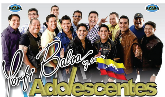
Jerry Rivera (der.) junto a Porfi Baloa y sus Adolescentes llegan en concierto al hotel Omni Shoreham Hotel en Washington, D.C.

Jerry Rivera quien es el eterno "Cara de niño", uno de los intérpretes más reconocidos del género, por su salsa sensual y melódica promete poner a bailar a todo el mundo en el Concierto