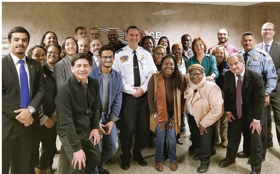
La Academia de Compromiso Comunitario de la Policía de Washington DC graduó a 30 personas residentes del área metropolitana.

El objetivo del Taller Cohorte, es que los miembros de la comunidad conozcan sobre la importancia de tener una conexión con la policía para tener una comunidad segura.