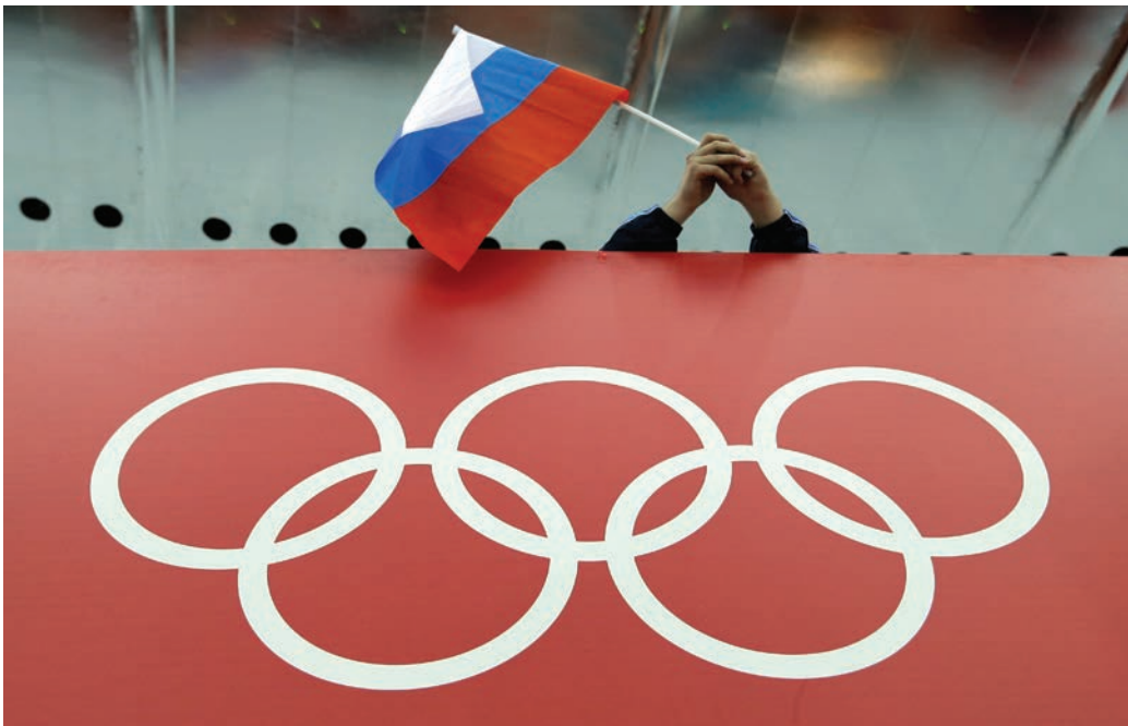
La investigación contra la delegación rusa inició después de los juegos olímpicos de invierno que se registraron en la ciudad de Sochi, Rusia. Varios atletas dieron positivo a uso de drogas prohibidas.

"Se han estado preparando todas sus carreras para