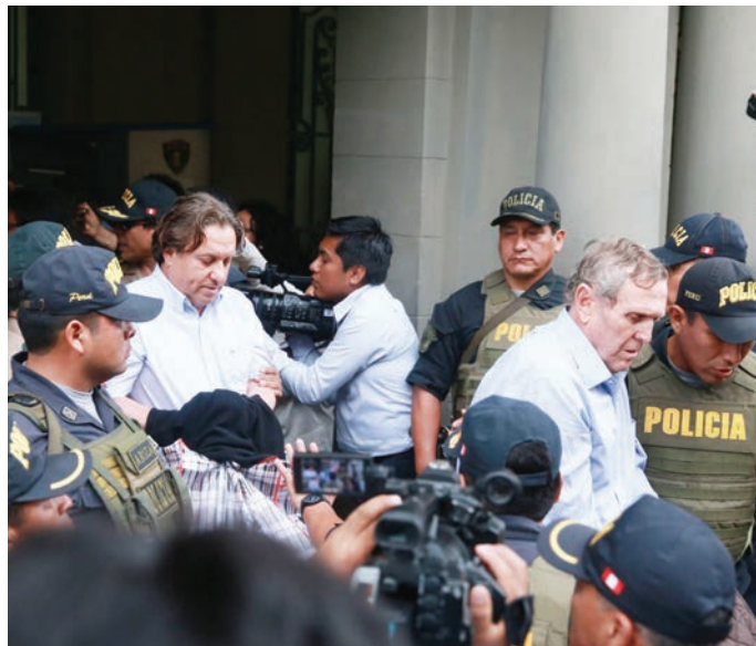
Dos de los cinco líderes empresariales peruanos y exsocios de Odebrecht acusados de reunir sobornos para el expresidente del Perú, Alejandro Toledo, salen de un centro de detención del Palacio de Justicia en Lima, Perú, rumbo a un penal de máxima seguridad, el lunes 4.