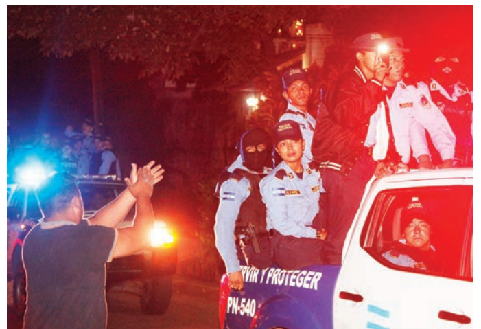
Un ciudadano de Tegucigalpa aplaude a los policías que retornan en vehículos a sus cuarteles tras negarse a enfrentarse con manifestantes durante el toque de queda para evitar derramamientos de sangre.

“Lo que exigimos es que la paz se instale en Honduras, que la crisis se resuelva y no haya más muertes ni sangre”, añadió. Otros aseguraron que no han