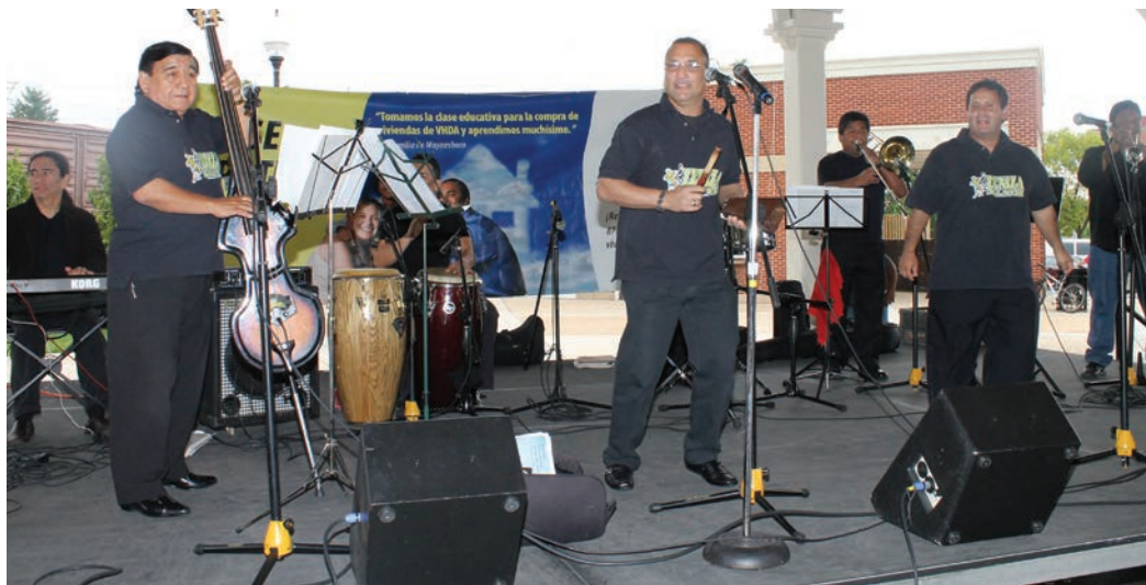
Recibe el año con alegría y música de la orquesta internacional de Zeniza All Star en el Aguila restaurante.

Para estar a tono con la ocasión, esta reconocida orquesta del área metropolitana de Washington, interpretará sus originales de temas de clásicos valsos