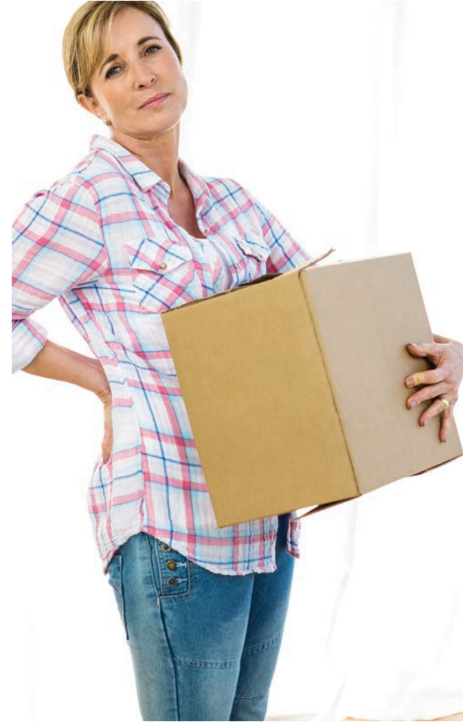
El dolor de espalda es un problema común en Estados Unidos, pero hay formas de protegerse.

derse hacia la pierna. ■ La ciática es común con un disco herniado. Esto incluye dolor en la nalga y pierna y hasta entumecimiento, cosquilleo, o debilidad que continúa hacia el pie. Es posible padecer de ciática sin tener dolor de espalda. Sin importar su edad o sus síntomas, si su dolor de espalda no mejora en unas pocas semanas, o si está acompañado por