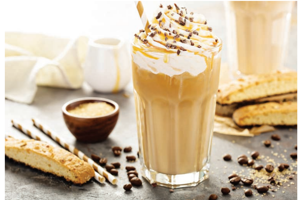
Las bebidas con sabores calidos están repletas de calorías, desde una mocha con menta, el latte chai y la azucarada cidra de manzana y al rompopo.

Algunas maneras para hacer más saludables a las bebi-