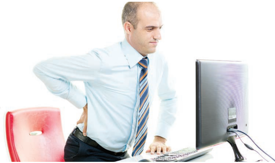
MAYOCLINIC REDACCIÓN WASHINGTON HISPANIC

Los eventos de dolor de la espalda lumbar son comunes entre los adultos y alrededor del 80 por cien-