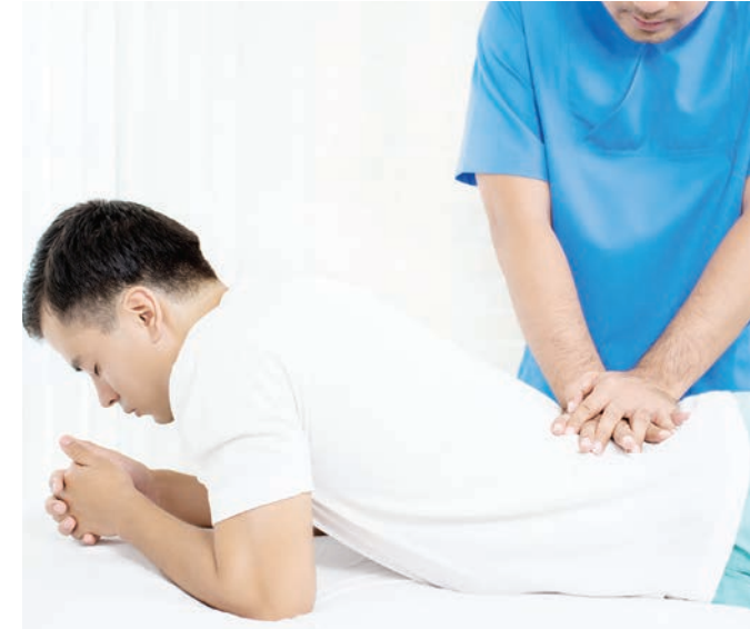
La mayoría de los dolores de espalda desaparecen espontáneamente, aunque otros pueden demorar algún tiempo.

derse hacia la pierna. ■ La ciática es común con un disco herniado. Esto incluye dolor en la nalga y pierna y hasta entumecimiento, cosquilleo, o debilidad que continúa hacia el pie. Es posible padecer de ciática sin tener dolor de espalda. Sin importar su edad o sus síntomas, si su dolor de espalda no mejora en unas pocas semanas, o si está acompañado por