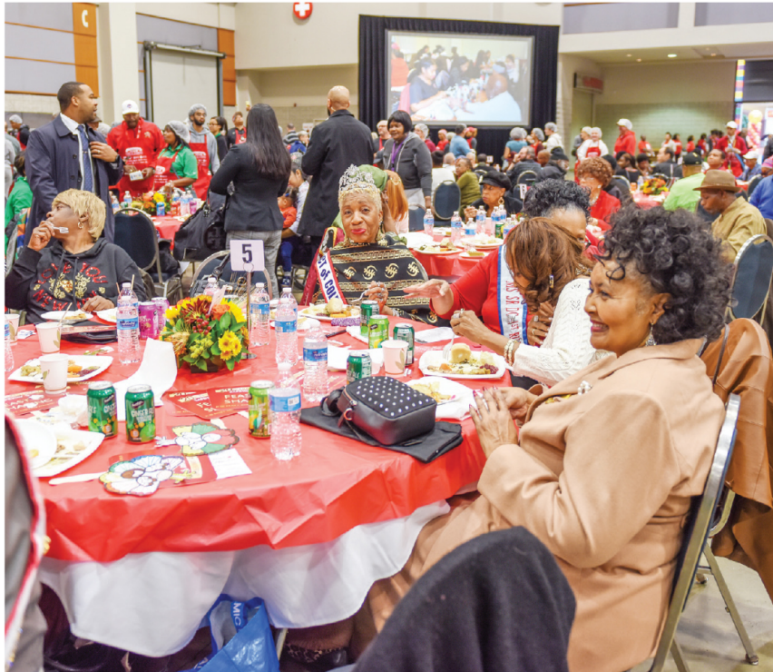
Alegria y entusiasmo muestran los residentes de menores recursos en DC, en uno de los ambientes del Centro de Convenciones de Washington habilitados como comedores, el miércoles 27.

Por último, no faltaron los cortes de cabello para hombres y manicure para damas ofrecida también gratuitamente por Bennett Career Institute.