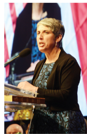
La iniciativa fue presentada por la concejal Elissa Silverman (Independiente, At-Large).

La medida fue propuesta el pasado martes y se encuentra en el comité de transporte del consejo. Si la propuesta se llega a votar antes de que finalice el periodo legislativo, la iniciativa podría implementarse tan temprano como el otro año.