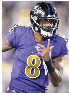
El lunes por la noche con 15 pases completos en 20 intentos para 169 yardas.

Lamar Jackson igualó una marca personal con cinco pases de touchdown y corrió para 95 yardas en otra espectacular actuación por tierra y aire, y los Ravens de Baltimore aplastaron el lunes 45-6 a los Rams de Los Ángeles para su séptima victoria en fila. Mark Ingram corrió para 111 yardas y un touchdown y tuvo una recepción anotadora mientras los Ravens (9-2) se convertían en el cuarto equipo en el siglo 21 en conseguir touchdowns en sus primeras seis series de un partido. Con Jackson operando de manera prácticamente perfecta, Baltimore humilló a una otrora sólida defensiva de los Rams, acumulando 480 yardas con su característico estilo vertical.