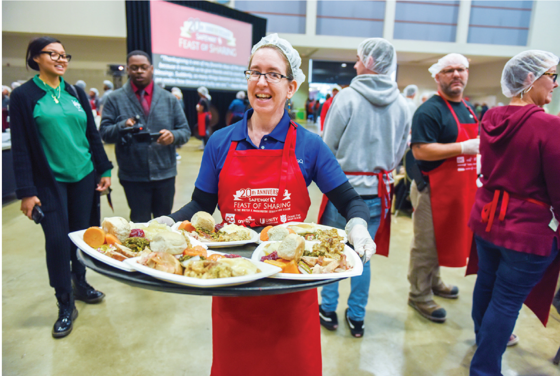
En una gran bandeja, una voluntaria de Safeway Feast of Sharing lleva los platos bien surtidos de pavo con ensalada de verduras a los comedores donde centenares de personas degustaron la comida por Acción de Gracias en el Centro de Convenciones de Washington.

"Para todos nosotros es un placer y un privilegio devolver todo esto a la comunidad que nos apoya, no sólo durante la temporada de fiestas sino a lo largo de todo el año", dijo entre