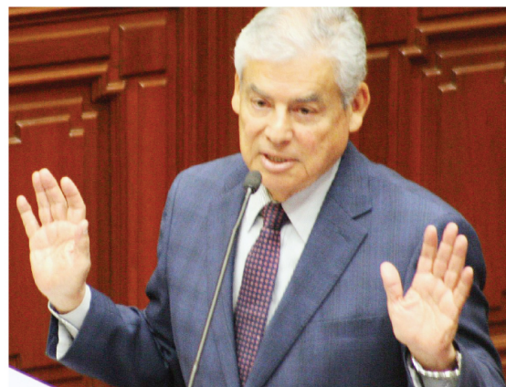
César Villanueva, ex premier del actual presidente peruano Martín Vizcarra, ahora está detenido.