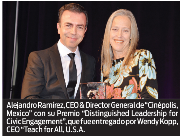
Alejandro Ramírez, CEO & Director General de "Cinépolis, Mexico" con su Premio "Distinguished Leadership for Civic Engagement", que fue entregado por Wendy Kopp, CEO "Teach for All, U.S.A."