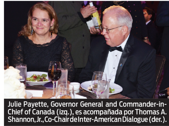
Julie Payette, Governor General and Commander-in-Chief of Canada (izq.), es acompañada por Thomas A. Shannon, Jr., Co-Chair de Inter-American Dialogue (der.).