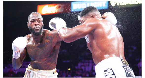
Deontay Wilder (izq.).

Elex volante creativo no dio detalles de su eventual gestión, pero reconoció que el máximo artillero en la historia del seleccionado de Perú es de su gusto.