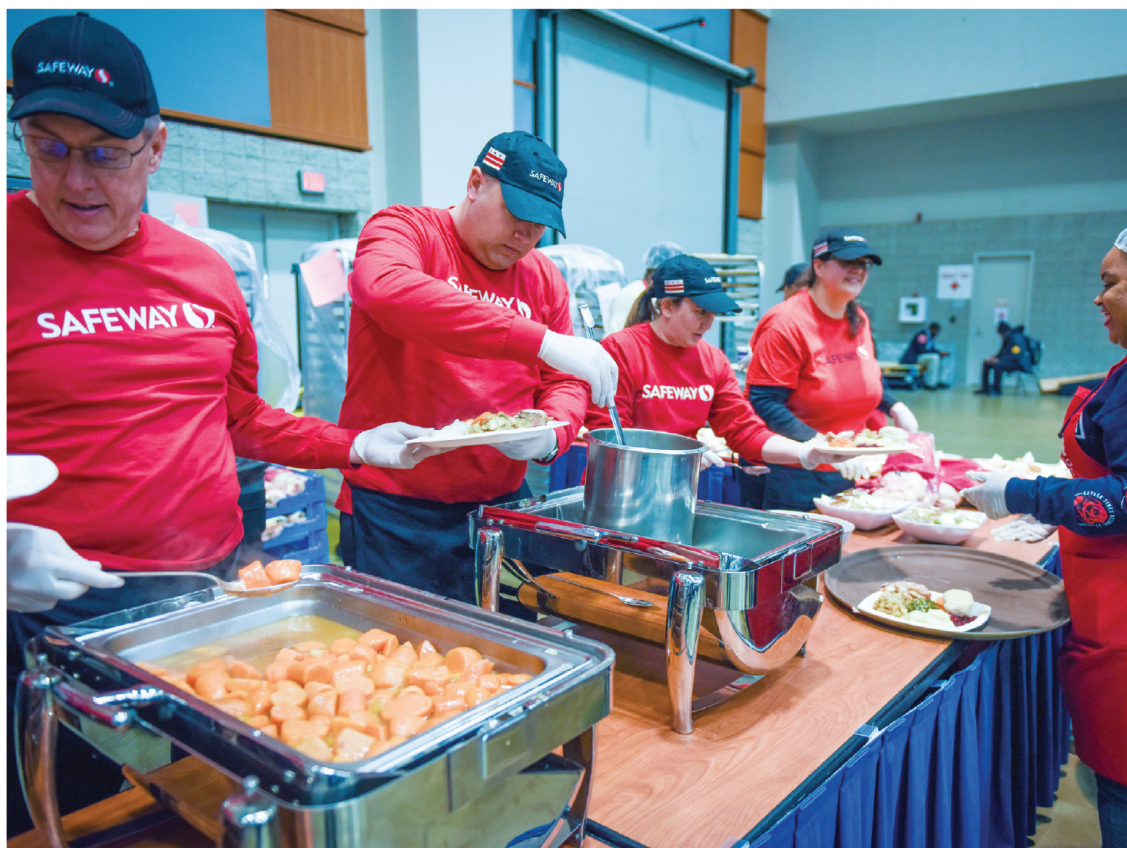
Voluntarios de Safeway ayudan a servir los deliciosos platillos de pavo y ensalada que degustaron miles de personas de diversas comunidades en el Centro de Convenciones de Washington, al mediodía del miércoles 27.