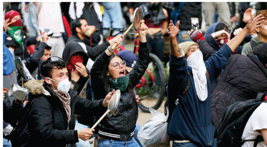
Las manifestaciones de protesta se han multiplicado en Bogotá y otras ciudades de Colombia en los últimos días, dejando un saldo de cuatro muertos hasta el miércoles.

Las conversaciones parecían la vía más prometedora para poner fin a una semana de manifestaciones diarias que unió en las calles