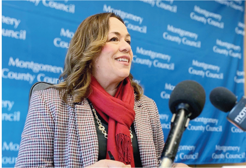
Nancy Navarro, concejal del Distrito 4, culmina esta semana su segundo periodo como presidenta del Consejo en los 10 años que ha servido en este suburbio de Washington.