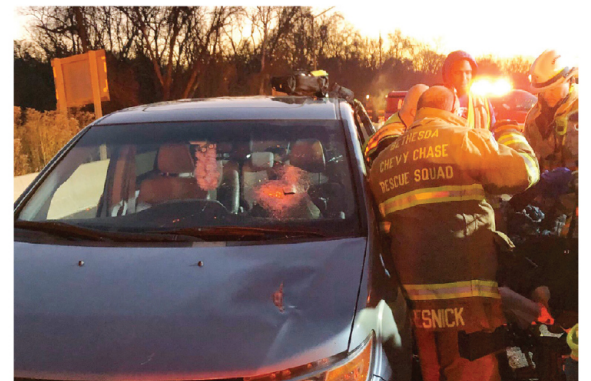
Docenas de bomberos del condado de Montgomery utilizaron las pinzas para liberar a la mujer atrapada en el lado del conductor.

Los expertos tuvieron que utilizar pinzas especiales para liberar a la mujer de la camioneta Honda que conducía, quien posteriormente fue trasladada a un hospital para recibir atención de urgencia. En total se estima que una decena