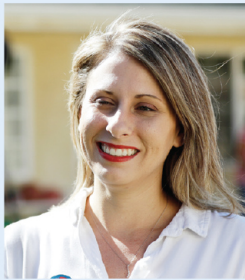
Katie Hill , congresista de California.

La congresista demócrata Katie Hill, una estrella en ascenso en la Cámara de Representantes, renunció en medio de una investigación de ética y dijo que fotos explícitas privadas de ella con un integrante de su campaña fueron “usadas como armas” por su esposo y operadores políticos.