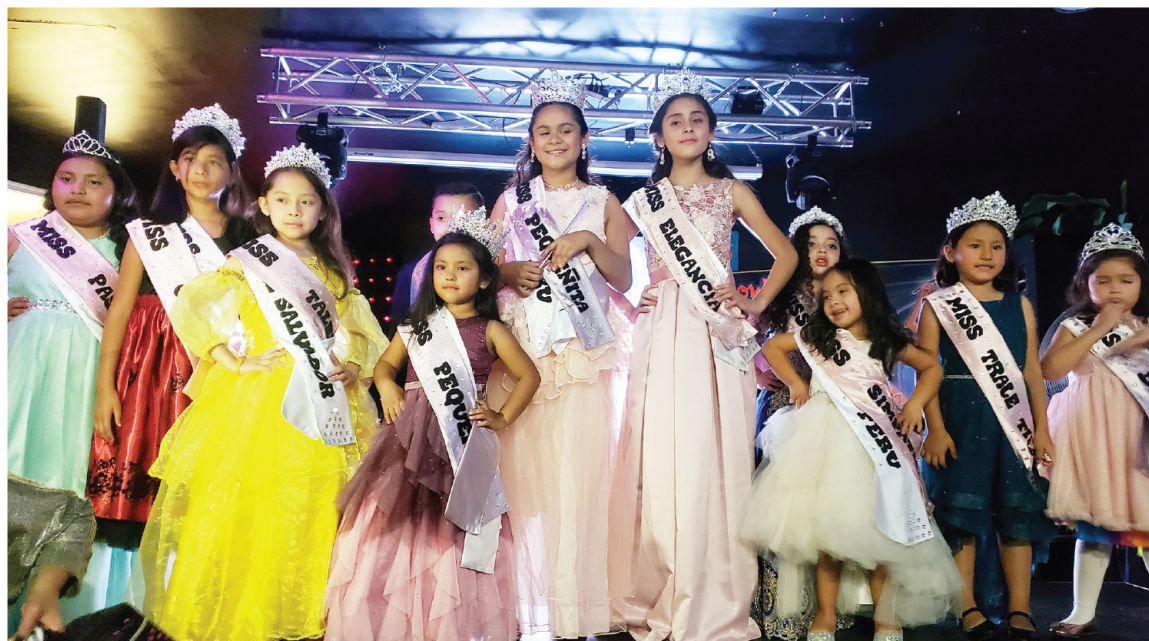
Con mucho entusiasmo los niños participaron del concurso.