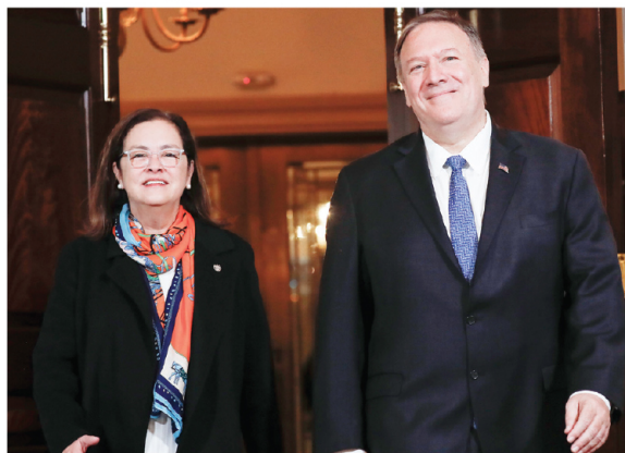
La canciller salvadoreña Alexandra Hill (izq.) en una reunión anterior con el secretario de Estado Mike Pompeo en Washington. Hill también declaró sobre la extensión del TPS.

Horas después, en otro comunicado, DHS aclaró que no se trata de una ampliación del programa, sino de “un periodo adicional” para que los actuales be-