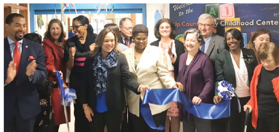
El centro brinda la oportunidad de que los niños menores de cinco años tengan acceso a una educación de calidad y a un precio asequible.

En las mismas instalaciones en la 18100 de la Washington Grove Lane, en Gaithersburg, se ubica el Centro de Integración Familiar (FIC), manejado por el Departamento de Salud y Servicios Humanos del Condado de Montgomery. Este centro provee un programa de educación avanzada.