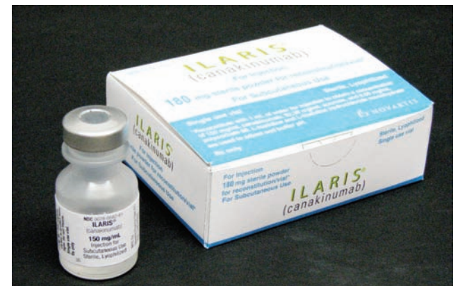
El canakinumab se vende bajo el nombre de Ilaris.

El canakinumab reduce la CRP y se vende bajo el nombre de Ilaris.