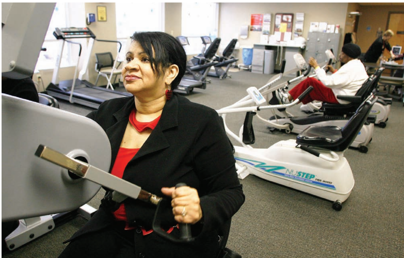
Muchos infartos cardiacos ocurren a personas cuyos niveles de colesterol son normales y que su principal riesgo es la inflamación crónica que tapa las arterias.

“De repente nos enteramos que podemos atacar la