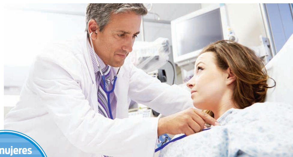
Converse con su médico sobre los riesgos y beneficios de tomar aspirina con base en su factor de riesgo individual.

No. Las mujeres de todas las edades deben tomar en serio la enfermedad del corazón. Las mujeres menores de 65 años, y especialmente aquellas con un historial familiar de enfermedad del corazón, deben pres-