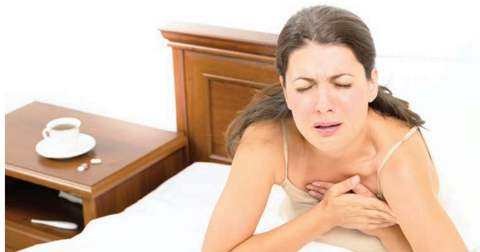
Perder incluso una cantidad pequeña de peso puede ayudar a disminuir su presión arterial y de tener diabetes ambas aumentan el riesgo de enfermedad del corazón.