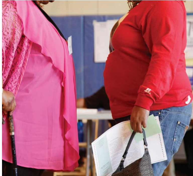
La tasa de obesidad en las mujeres es mayor que la de los hombres en todo el mundo, aunque mucho más baja en general que en los Estados Unidos.

Los estudios del peso de los niños han mostrado también una estabilización a lo largo de los últimos 10 años, además de una caída reciente en la cantidad de preescolares obe-