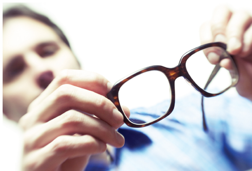
La fatiga visual provoca ardor y ojos enrojecidos.

■ Como ya no puede enfocar bien, recurre a estas so-