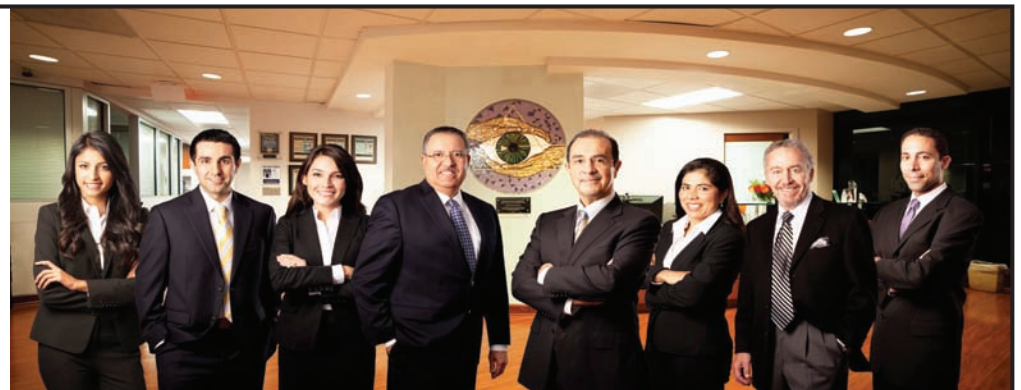
EN ORDEN DE IZQUIERDA A DERECHA:

Teléfono: 301-896-0890 • www.voeyedr.com