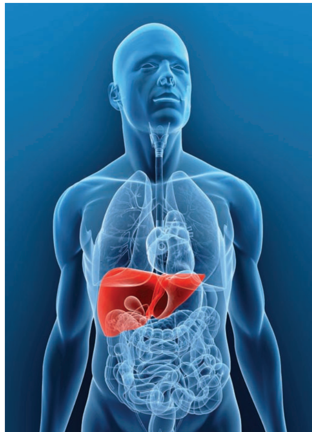
El hígado realiza una gran variedad de funciones en el cuerpo, entre las cuales están la desintoxicación de la sangre y la producción de bilis que ayuda en la digestión.