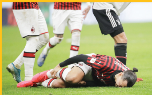
El talón de Aquiles de Ibrahimović está intacto.