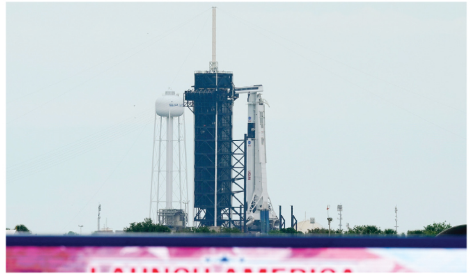
El Falcon 9 de SpaceX, con la cápsula Dragon en lo más alto del cohete, es vista en cuenta regresiva la tarde del miércoles en el Centro Espacial Kennedy, poco antes de aplazarse el lanzamiento por mal tiempo. El vuelo se aplazó para este sábado.

Tanto el presidente Donald Trump como el vicepresidente Mike Pence