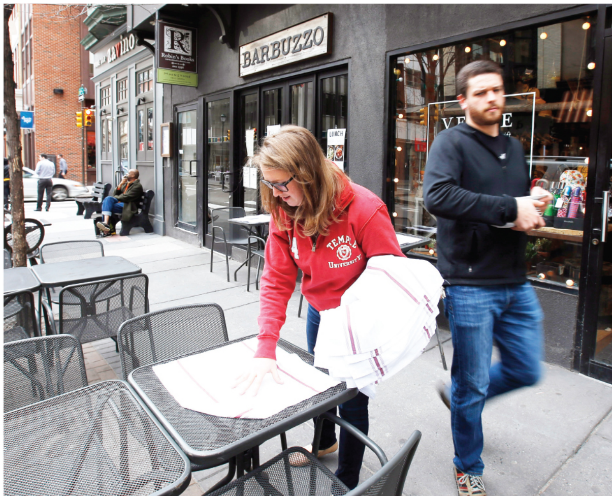
Los trabajadores preparan un área de descanso al aire libre en Barbuzzo, una cocina mediterránea y un bar, a lo largo de la calle 13 en Filadelfia. Así se verá en el área metropolitana de Washington.

Vuelven miles de negocios, pero con algunas restricciones.