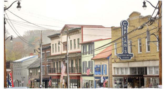
Más de un millar de negocios minoristas, así como peluquerías y barberías, volverán a funcionar en el condado de Howard. La vista corresponde a la Main Street de la ciudad de Ellicott.

El jueves por la tarde, el Ejecutivo de Montgomery, Marc Elrich, señaló que las cifras de contagios