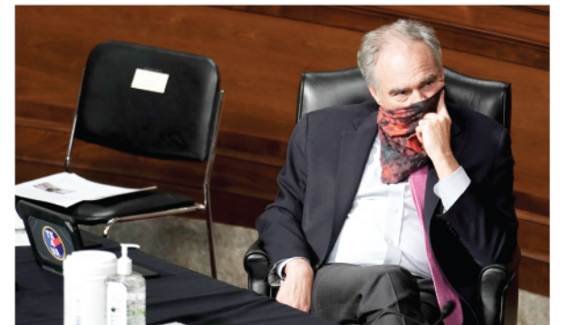
Usando mascarilla y con un gel antibacterial a la mano, el senador demócrata Tim Kaine asiste a una reciente sesión del Comité de Servicios Armados del Senado. Kaine y su esposa estuvieron en cuarentena al ser afectados por el coronavirus.

Después, sus médicos les dijeron que "posible-