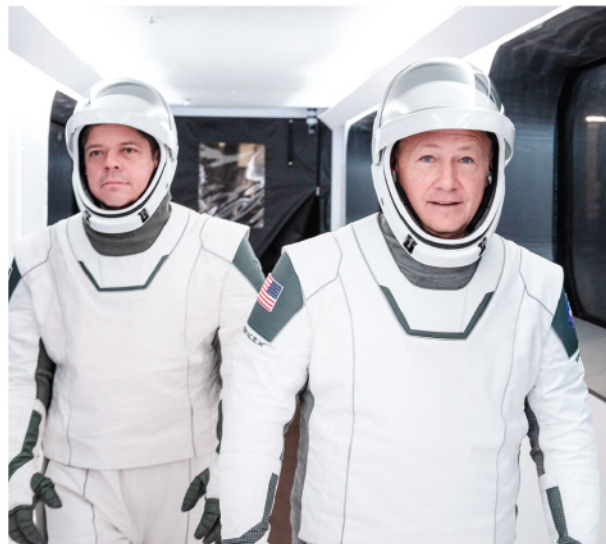
Los astronautas Bob Behnken (izquierda) y Doug Hurley llevan sus modernos trajes espaciales que hacen recordar a los de la saga Star Wars, rumbo a la torre de lanzamiento de la nave SpaceX, el miércoles 27.

NASA, Doug Hurley y Bob Behnken, les gusta el nuevo aspecto. Viajan hasta la cápsula de lanzamiento en el automóvil eléctrico Model X de Tesla.