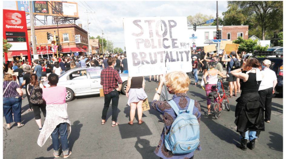
La muerte de George Floyd provocó protestas en Minneapolis y otras ciudades del país en contra del abuso de autoridad y racismo en contra de los negros.

“Ser negro en Estados Unidos no debería ser una sentencia de muerte. Durante cinco minutos, observamos a un agente blanco presionar su rodilla contra el cuello de un hombre negro. Cinco minutos. Cuando escuchas a alguien pedir ayuda, se supone