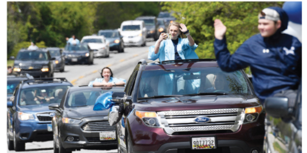
Al tratarse de un momento histórico en sus vidas, los jóvenes se las ingenian para hacer de su graduación un momento inolvidable.