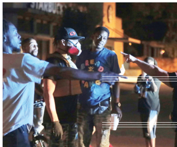
Manifestantes se enfrentan a la policía durante una protesta por la muerte de George Floyd el jueves 28 de mayo de 2020 en Memphis.

La tragedia en la que George Floyd clama que no puede respirar mientras el policía presiona el cuello con su rodilla se hizo viral en cuestión de horas y desató la ira de las personas que están cansadas de