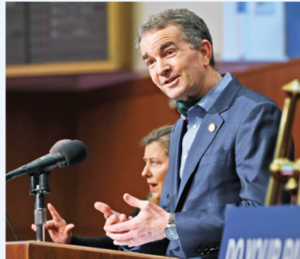
Gobernador Ralph Northam, de Virginia.

Se dispone por ejemplo que los restaurantes y las cervecerías vendan sus productos por entrega, salvo en aquellos establecimientos que cuenten con el