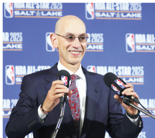
En esta foto de archivo del 23 de octubre de 2019, el comisionado de la NBA, Adam Silver, habla durante una conferencia de prensa en el Vivint Smart Home Arena en Salt Lake City.