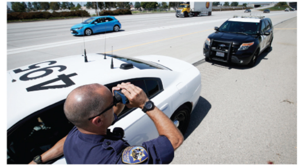
Cientos de motoristas fueron multados en Maryland y Virginia por conducir a velocidades que doblaban el límite impuesto en las autopistas.

“Estamos particularmente preocupados por