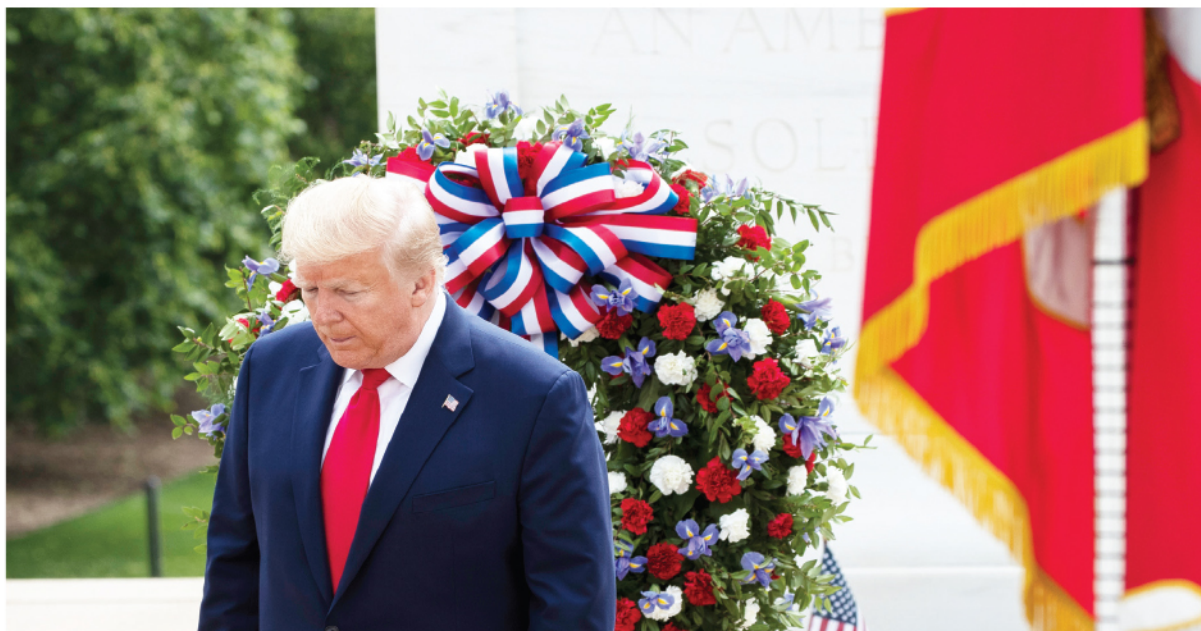
El presidente Donald Trump participó el pasado 25 de mayo de la ceremonia anual de recordación a los soldados que entregaron su vida sirviendo al país. En la foto, se da vuelta después de colocar una corona de flores en la Tumba del Soldado Desconocido en el Cementerio Nacional de Arlington. También participó de otras ceremonias en Baltimore, Maryland.