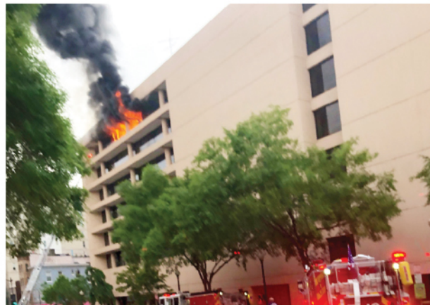
El incendio comenzó poco después de las 6:00 de la mañana del miércoles y atrajo a cientos de bomberos que sofocaron las llamas un tiempo después.

do, al agente. La víctima fue identificada como George Floyd por Ben Crump, un prominente abogado de derechos civiles que dijo que había sido contratado por la familia de Floyd.