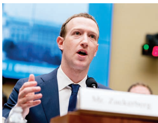
Mark Zuckerberg, director general de Facebook, hace una pausa durante su comparecencia ante las comisiones de Energía y Comercio de la Cámara de Representantes en el Capitolio, el miércoles 11.