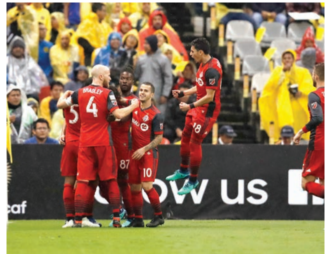
Jugadores de Toronto FC celebran el tanto que marcaron en la ciudad de México ante el club América. Ahora deberán enfrentarse a Chivas por el trofeo.

a su favor. El partido de vuelta fue particularmente unilateral a favor de los anfitriones, y el equipo de la MLS no pudo convertir uno de sus 20 tiros en el gol de Chivas para igualar el empate. El partido de ida de la final de la Liga de Campeones Concacaf Scotiabank se jugará el martes 17 de abril cuando Toronto FC recibirá al CD Guadalajara en el BMO