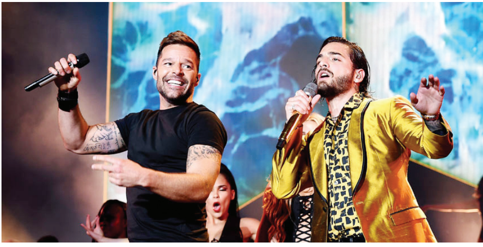
Ricky Martin sorprendió a los fans de Maluma al subir al escenario y cantar 'Vente pa' ca'.