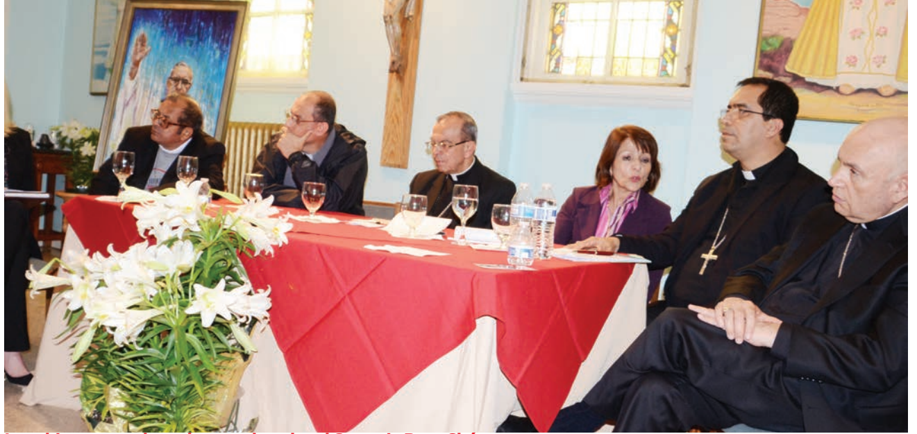
Los obispos, encabezados por el cardenal Gregorio Rosa Chávez, explicaron en una conferencia de prensa el motivo de su visita a la capital de la nación, en donde también compartieron con feligreses en diferentes misas que se llevaron a cabo durante la semana.

para ellos. Durante la semana pasada los obispos no sólo sostuvieron conversaciones con funcionarios del Departamento de Seguridad Nacional y el Congreso, sino que realizaron varias misas en el área metropolitana de Washington en las que oraron por una solución a la situación, y escucharon de primera mano las preocupaciones que viven quienes hasta hace poco estaban amparados con el TPS. Los obispos señalaron que la deportación de los mi-