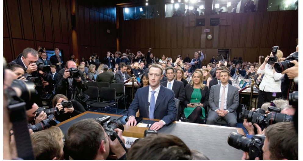
El fundador y director general de Facebook, Mark Zuckerberg, testifica ante una audiencia conjunta de los comités de Comercio y Judicial del Senado, el martes 10.

Fundador de la red social revela que está colaborando con investigación de la injerencia rusa en la campaña presidencial de 2016.