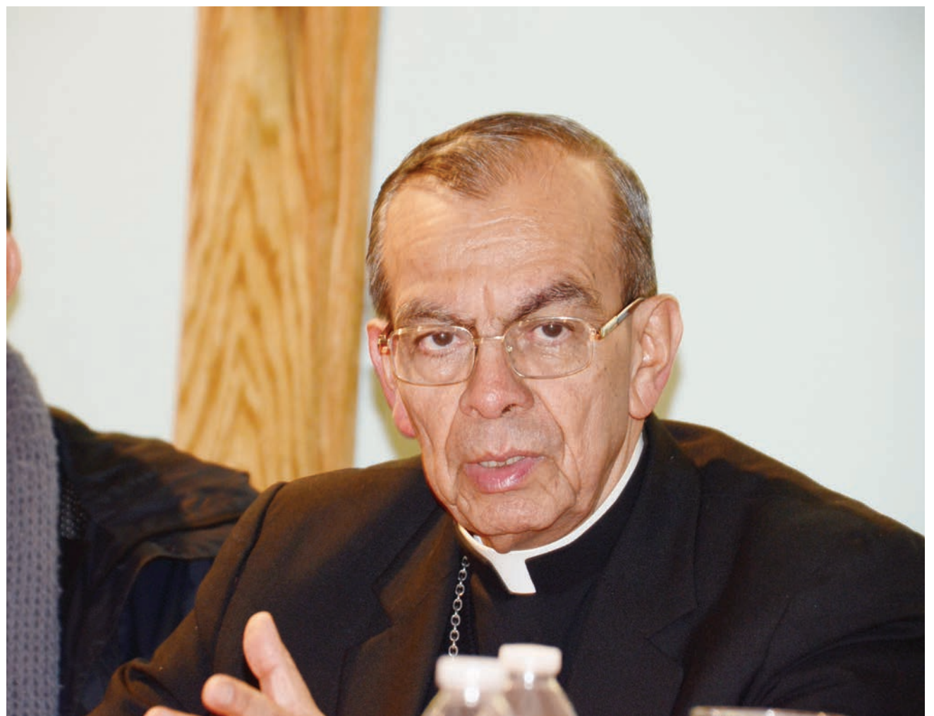
La delegación encabezada por el cardenal Gregorio Rosa Chávez (centro) se encuentra optimista de que los legisladores pasarán leyes que beneficien a los salvadoreños que llevan toda una vida en los Estados Unidos.