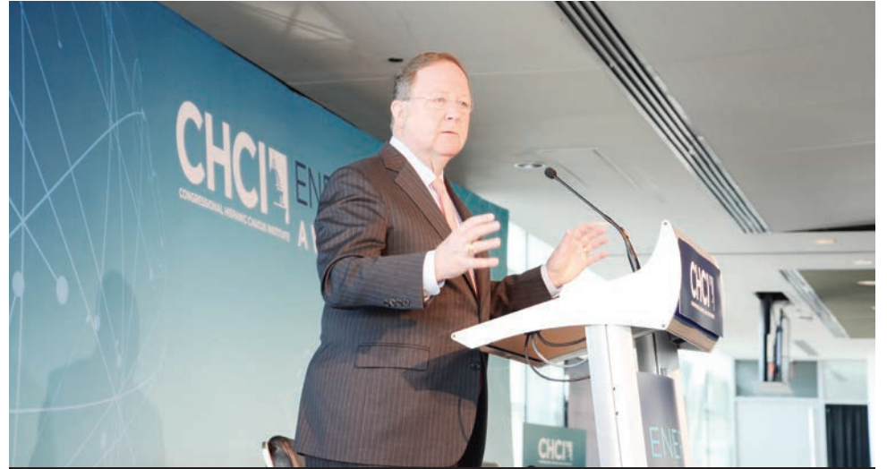
Bill Flores, congresista de Texas, de los Comités de Energía y Comercio, durante su presentación, después de la charla de Darren Soto, congresista de Florida, en el Opening Plenary, de la Cumbre Anual de Energía de CHCI, el 14 de marzo, en el Newseum.