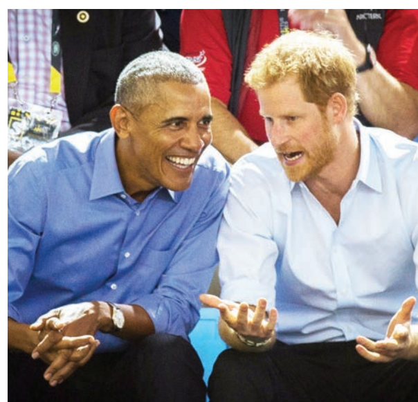
Un portavoz del Palacio de Kensington dijo que los líderes mundiales y las figuras políticas no serían invitados por el tema de la seguridad.