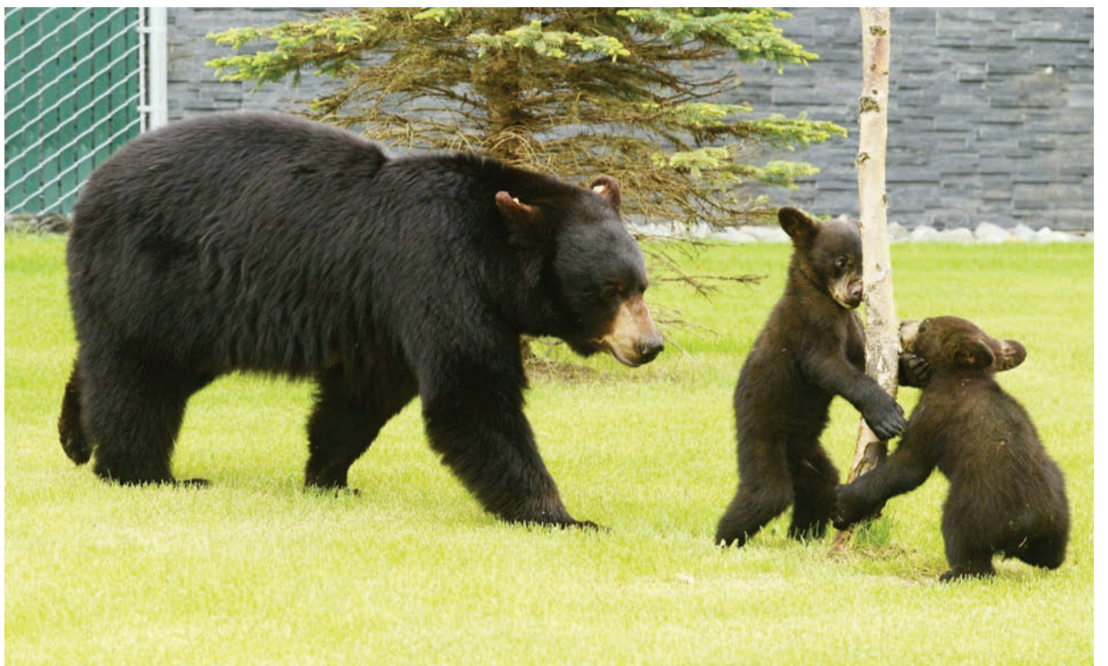
Los osos negros son comunes en nuestra región y en raras ocasiones atacan a los humanos con violencias. Cuando se encuentran por los vecindarios es que son atraídos por los olores de residuos de alimentos.