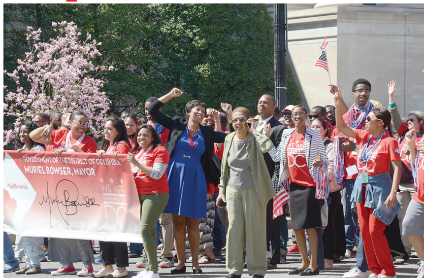
DC tiene preparado toda una agenda de actividades para conmemorar el Día de la Emancipación en DC.

Las autoridades también tienen programado un concierto en el Freedom Plaza, con la presentación de aproximadamente una decena de artistas locales,