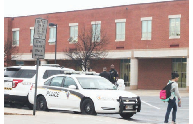
La seguridad policial en las escuelas de Maryland serán ampliadas a los centros educativos que no lo tengan, según una propuesta legislativa aprobada por ambas cámaras de la Asamblea estatal, en Annapolis, el lunes 9.

La legislación también prevé que las escuelas del área podrían tener sus salones de clases cerrados con llave y establece ejercicios o simulacros contra amenazas