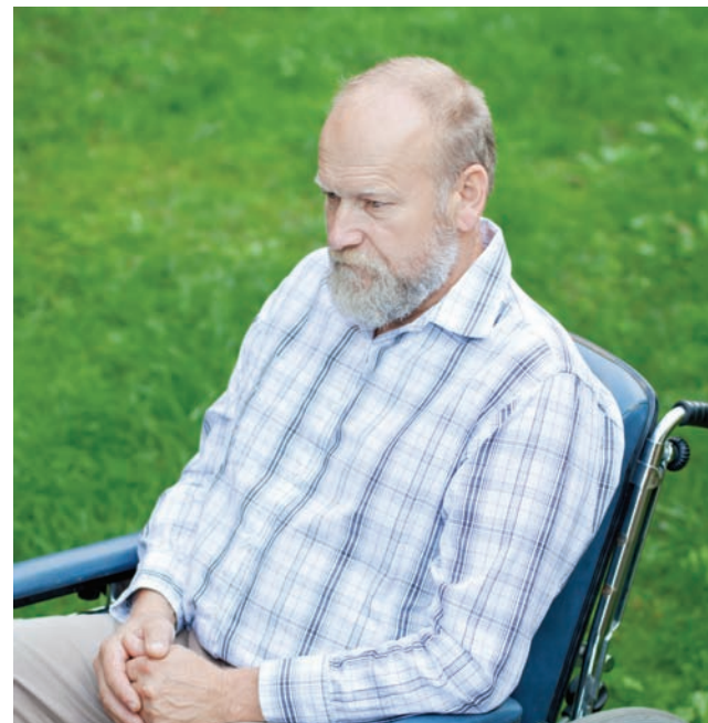
La Administración de Alimentos y Medicamentos aprobó las pastillas de Xadago.

de “apagado” y mejores puntuaciones en una medida de la función motora