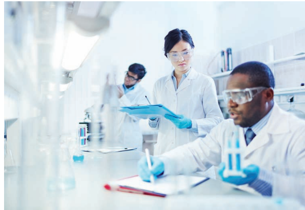
La participación de las personas en los estudios clínicos puede beneficiarlo a usted mismo y a futuras generaciones que resulten con el mismo problema.