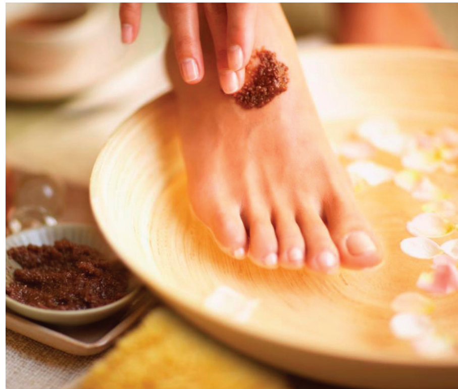
Las infecciones fúngicas en las uñas son contagiosas, es importante tomar precauciones para reducir el riesgo de contraerlas.

Nunca use el calzado de otra persona ni comparta cortaúñas ni limas. Si va a un salón de uñas, asegúrese de que el personal limpie las herramientas y desinfecte completamente los baños de pies antes de cada uso, o utilice su propio baño de pies. Si el salón no parece limpio, vaya a otro, enfatizó Zeichner.