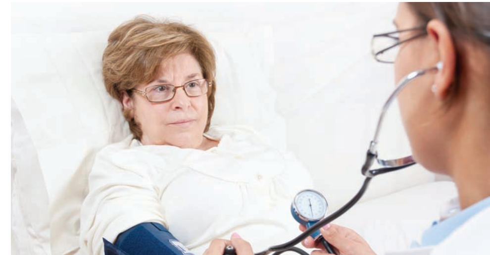
Participar en un ensayo clínico no acarrea costos para los pacientes, si las personas tienen seguro médico este será un complemento para sus tratamientos.

así como se hace en la clínica de Tyson Corner en Virginia.